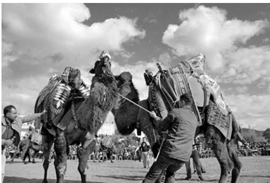
Рис. 4. Верблюжьи бои

Правила для всех боев одинаковы, хотя и нигде не прописаны. Обычно мероприятие начинается в 9–10 часов утра. Бой идет не более 10 минут, хотя в 1980-е годы этот период составлял 15 минут, а еще раньше — полчаса. В соревнованиях обычно принимают участие около 100 верблюдов, которых привозят со всего региона на грузовиках (рис. 4).