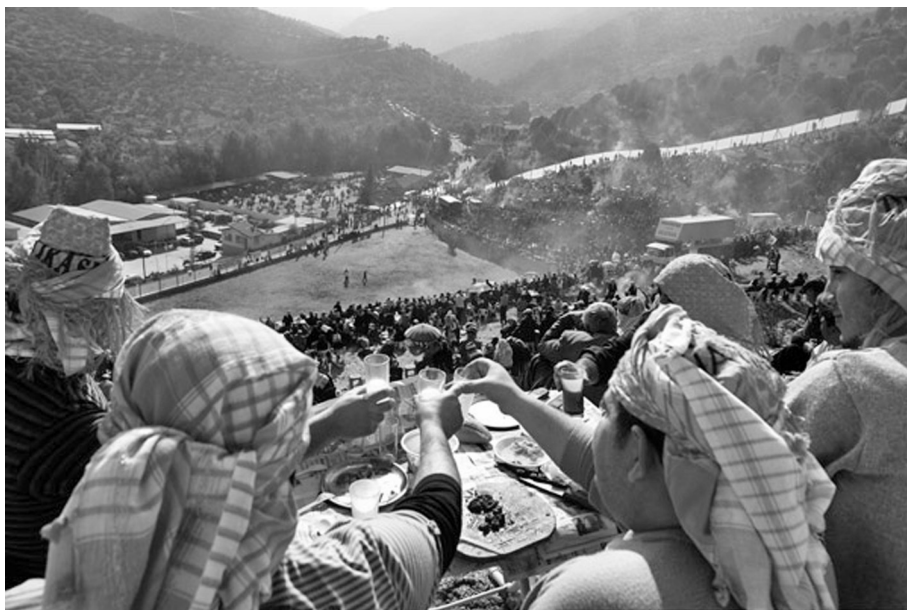
Рис. 6. Зрители боев за стаканчиком ракы ( http://www.anafot.net/FOTOMAKALE-43-deve-guresi )

Количество зрителей на одном мероприятии варьирует от двух с половиной до пяти тысяч (табл. 2). Сейчас некоторые верблюжьи бои даже транс-