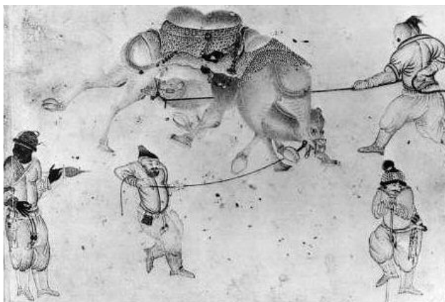
Рис. 3. Миниатюра из собрания Библиотеки Топкапы (по: [Ars Orientalis 1954: pl. 2, fig. 3])

В зимние месяцы, когда у кочевников появлялось свободное время, они устраивали себе различные увеселения, среди которых главное — верблюжьи бои. Тогда еще речь не шла о специальных верблюдах, содержащихся только для боев. Мероприятия были локального значения, а бои носили исключительно развлекательный характер. По сведениям Чалышкана, первые упоминания о верблюжьих боях в Анатолии относятся к XIX в. [Çalışkan 2009: 124], хотя изображения верблюжьих боев встречаются на иранских и могольских миниатюрах уже с XV в. (рис. 3). В китайских источниках говорится, что конные и верблюжьи бои устраивались древними тюрками перед обрядами в честь неба. Возможно, по результатам боя предсказывали будущее [Çoruhlu 2006: 150]. Верблюжьи бои проводились также в Афганистане и Пакистане [Ibrahimi 2007; Raza 2008]. Сегодня верблюжьи бои можно увидеть только в Анатолии.