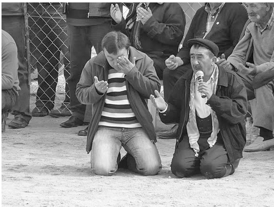
Рис. 9. Джазгыр за молитвой

На вечере выступают местные музыканты и приглашенные специально танцовщицы живота. В дополнение к эпосу Кероглу, сопровождаемому барабанами и зурной, танцуется народный танец зейбек , движения которого имитируют повадки сокола или ястреба (рис. 8). В этот вечер совершаются молитва, чтобы погода на следующий день была ясной и бои не отменились.