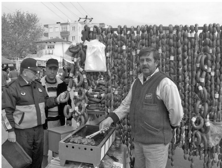
Рис. 5. Продавец верблюжьих сосисок ( http://www.edremithaber.com/modules.php?name=News&file=article&sid=3075 )

бенностями верблюжьих боев также являются анисовая водка ( ракы ) (рис. 6) и значительное количество зрителей. Эти характерные черты выделяют верблюжьи бои из ряда прочих спортивных мероприятий.