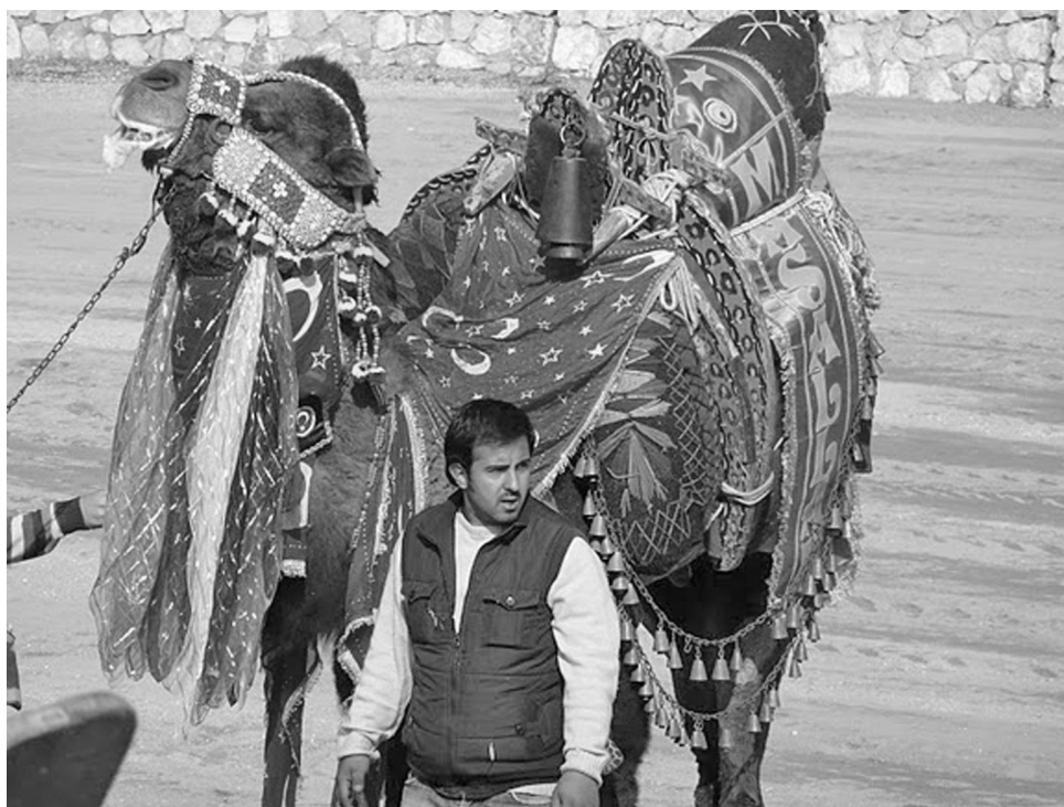
Рис. 7. Боевой верблюд в полной экипировке ( https://picasaweb.google.com/devecilercom2010/MILAS#5575346764914937730 )