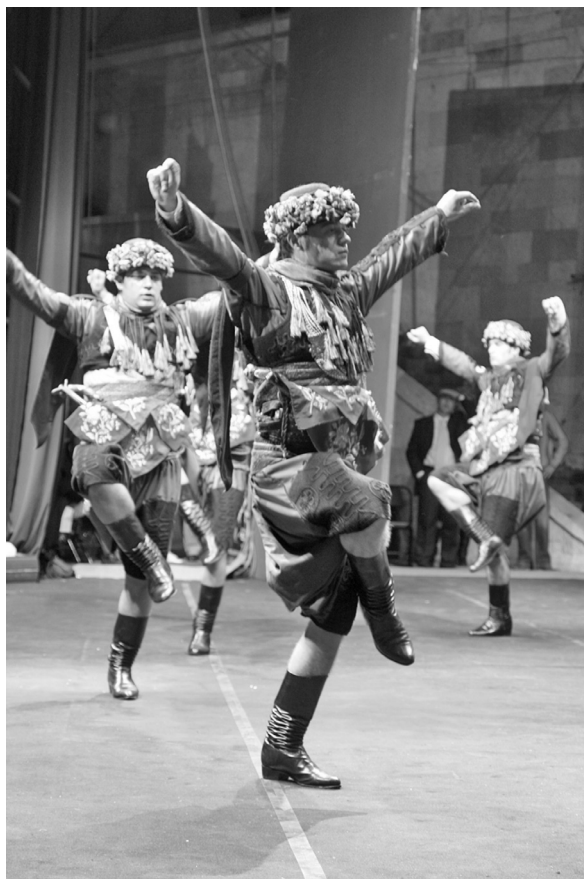
Рис. 8. Танец зейбек ( http://www.nevalp.org/?p=73 )

кроя и сапоги на меху со складками на голенище ( ефе чизмеси ) (рис. 8). Свое название сапоги получили в честь ефе — предводителей зейбеков .