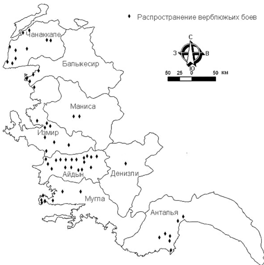
Рис. 2. Распространение верблюжьих боев