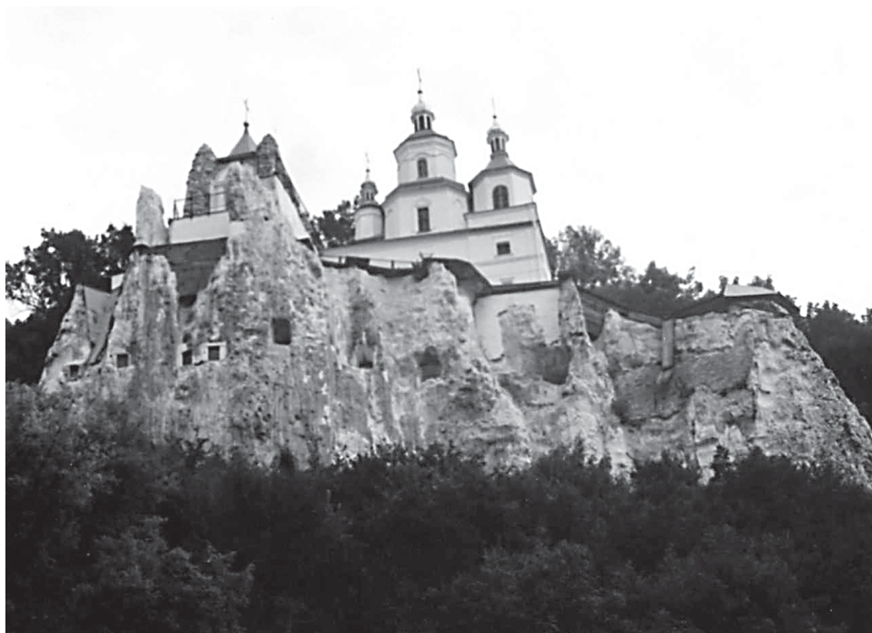
Рис. 3. Святогорская лавра (Донецкая область). Автор фото — Агапов И.А., 2001 г.

В дальнейшем в подземных монастырях появляются и укрепляются наземные комплексы и расширяются подземелия, работы в которых продолжались вплоть до начала XX в.: был окончательно завершён круговой ход вокруг подземной церкви в Дивногорском и Холковском монастырях; вырыт 160-метровый ход к наземным