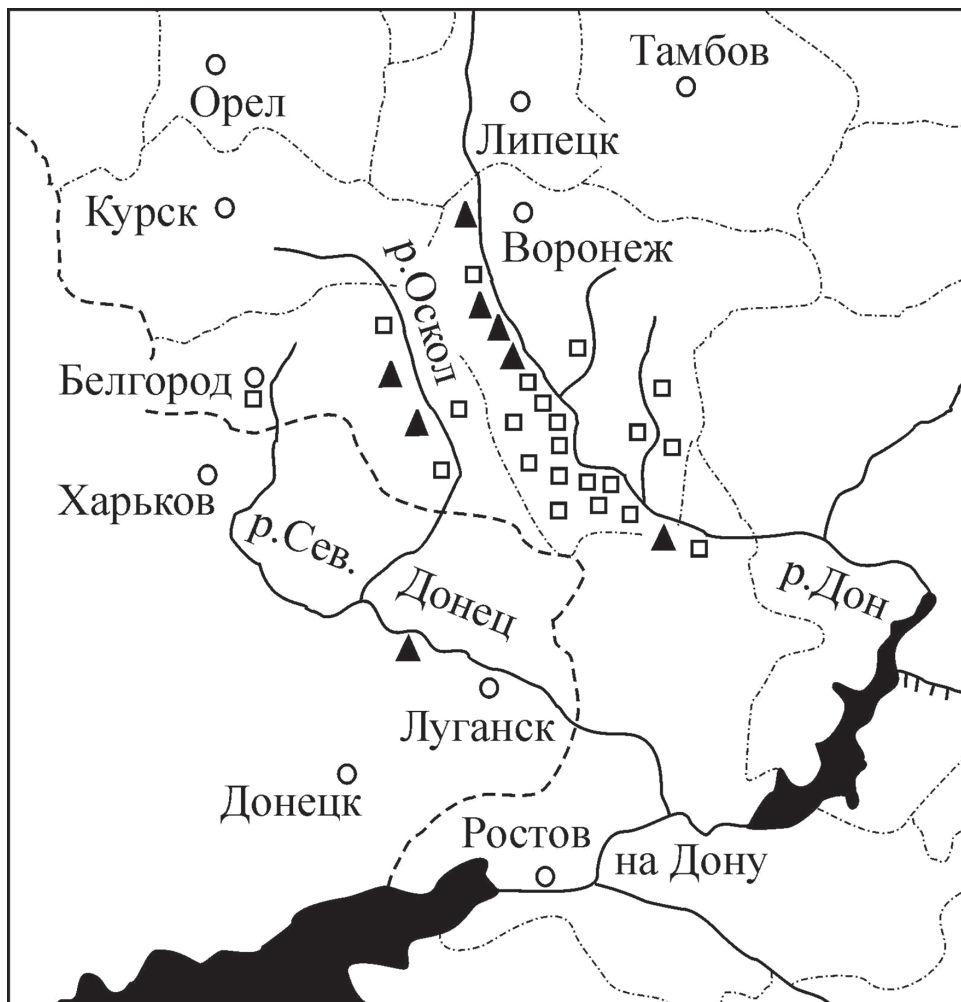
Рис. 1. Схема расположения культовых пещерных памятников среднего Подонья: