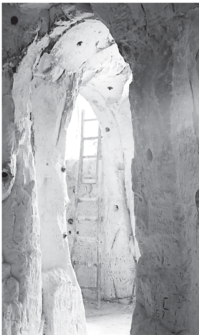
Рис. 6. Пещерный храм в Малых Дивах (Дивногорский монастырь). Автор фото — Агапов И.А., 2001 г.

Многие подземные церкви сооружались следующим способом. Рубилась прямоугольная сетка ходов, представляющая собой обычную колонную выработку, затем ходы расширялись по бокам и вверх. Таким образом, получалось обширное помещение с опор-