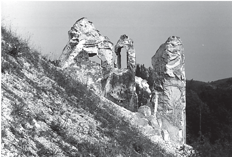
Рис. 2. Меловые останцы («Малые Дивы») с остатками помещений (кельи, колокольня) у Дивногорского монастыря (Воронежская область). Автор фото — Агапов И.А., 2001 г.

шей название «Шатрище». В склоне горы раньше также был меловой останец-«Дива». В нем были прорублены окна для освещения подземной церкви.