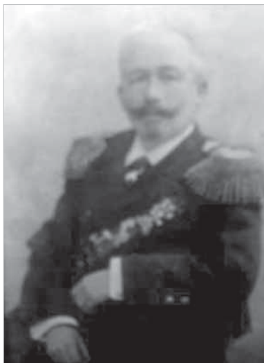
Рис. 4. М.И. Ван-дер-Шкрүф (1853–1920)

бурге сына Михаила, который сделал блестящую морскую карьеру 4 .