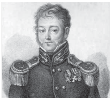
Рис. 1. П.И. Рикорд