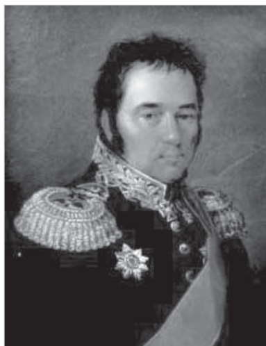
Рис. 2. В.М. Головнин

«Атака, предпринятая 30 августа французами, была отбита, после чего Брюн обратил все свое внимание на преграждение доступа к Гарлему и Амстердаму. Между тем стали прибывать остальные англо-русские войска; 7 сентября собрался, наконец, весь экспедиционный корпус. Как только высадились последние русские войска, герцог Йоркский решил безотлагательно атаковать неприятеля, занимавшего позицию в городе Бергене и его окрестностях. Атака была произведена 8 сентября и окончилась неудачей. Более всего пострадали при этом русские войска, которые уже овладели Бергеном, но, встреченные контратакой превосходных сил и своевременно не поддержанные, были выбиты оттуда со значительными потерями. Генералы Герман и Жеребцов попали в плен к французам. Союзники отступили на прежние позиции, потеряв около 4 тыс. человек (русские — до 3 тыс., англичане — около 1 тыс.). Герцог Йоркский решил предпринять новую атаку против французов и голландцев. Сражение, данное