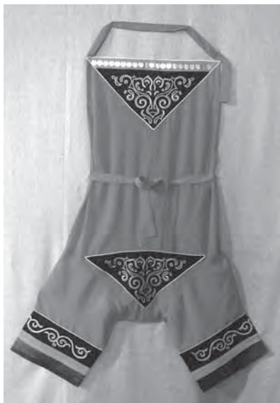
Рис. 22. Ритуальное нижнее белье ороцкой невесты. Мастер — Л.Е. Варшавская. Июль 2006 г.