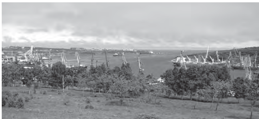
Рис. 20. Пгт Ванино. Июль 2006 г.