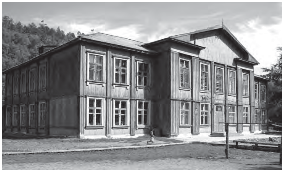
Рис. 17. Здание школы в с. Уська-Орочская. Июль 2006 г.