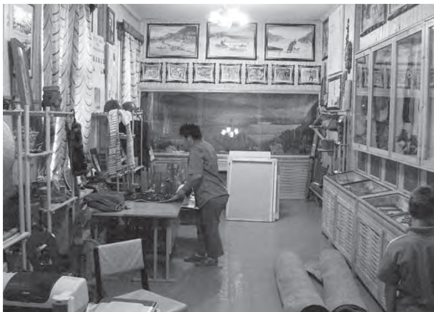
Рис. 18. Школьный музей с. Уська-Орочская. Июль 2006 г.