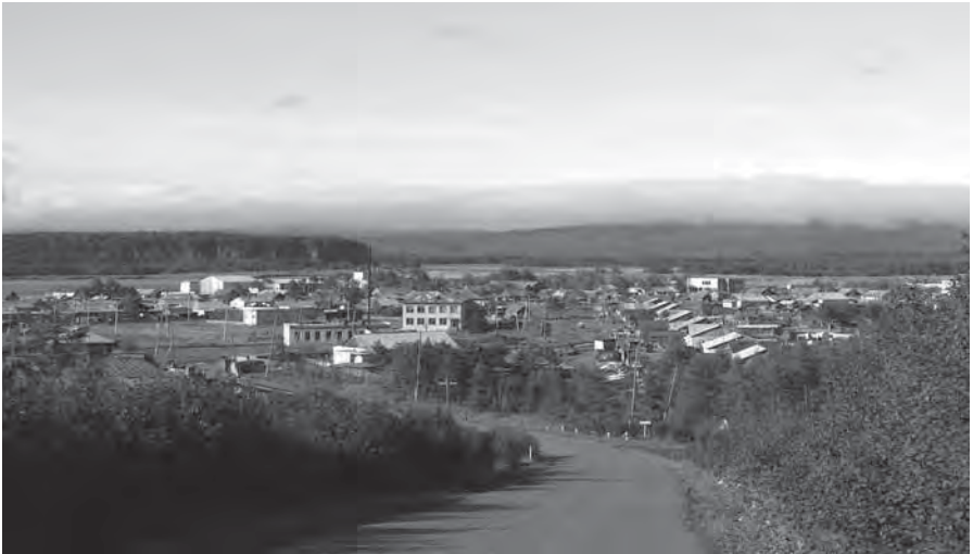
Рис. 1. Поселок Датта. Июль 2006 г.

В 2006 г. в районе расселения тумнинских орочей осуществляли хозяйственную деятельность четыре национальные общины КМНС: «НКХ» (Нацио-