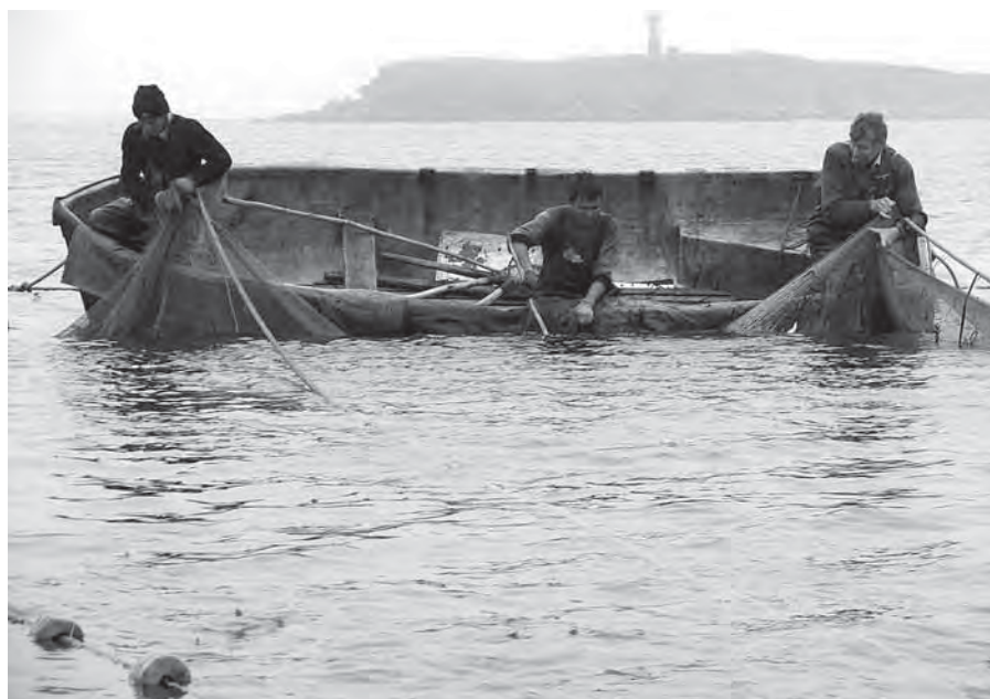
Рис. 5. Рыбная ловля в ЧП «Ильин». Июль 2006 г.