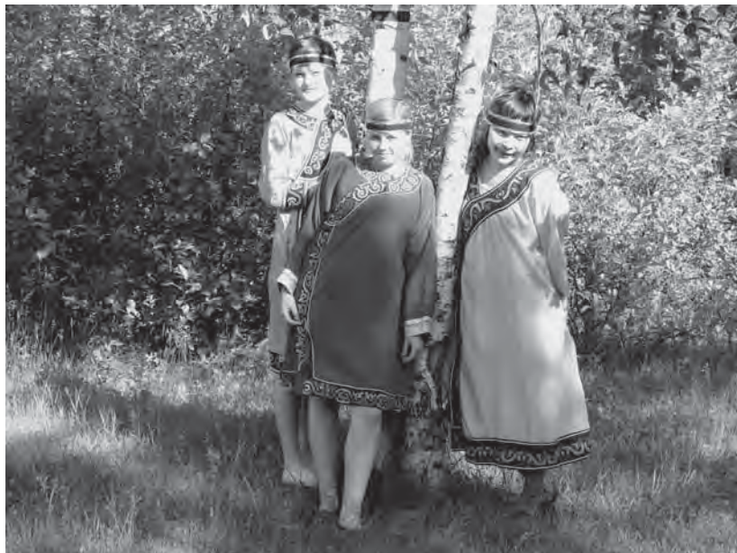
Рис. 7. Орочский танцевальный ансамбль «Мечта». Июль 2006 г.