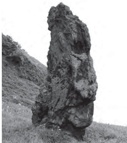
Рис. 10. Священная скала орочей Мапача. Июль 2006 г.