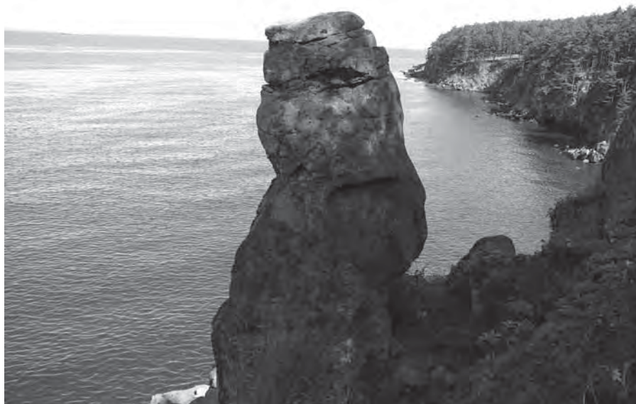
Рис. 14. Священная скала орочей Собака Мамача. Июль 2006 г.