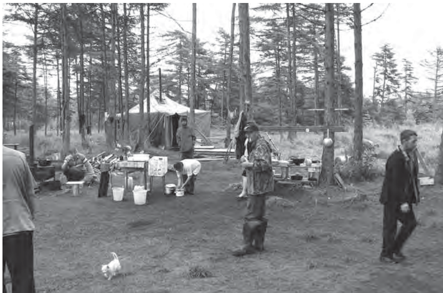
Рис. 4. Лагерь ЧП «Ильин». Июль 2006 г.