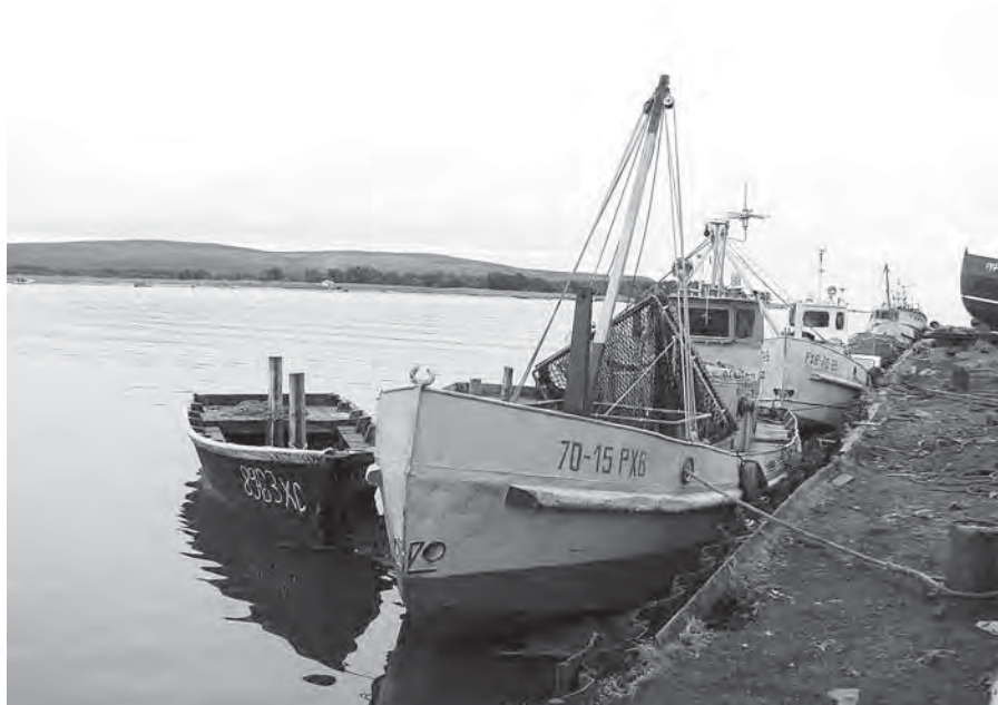
Рис. 2. Рыболовные суда орочской артели. Июль 2006 г.