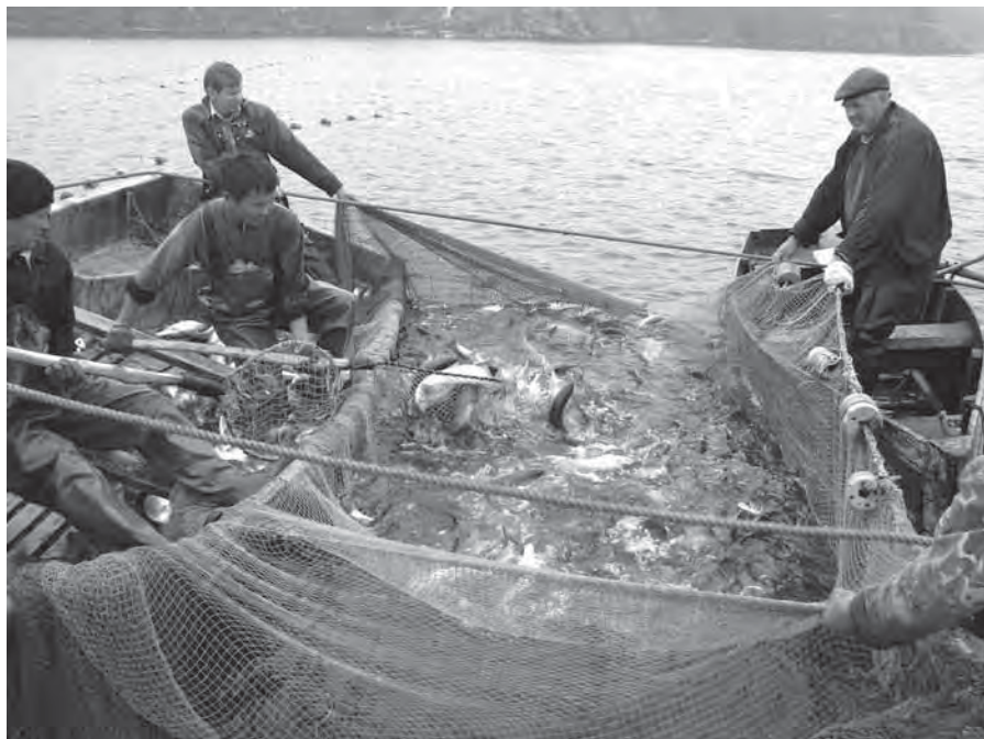
Рис. 6. Ловля горбуши в ЧП «Ильин». Июль 2006 г.