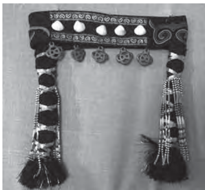
Рис. 23. Шаманский головной убор. Мастер — Л.Е. Варшавская. Июль 2006 г.