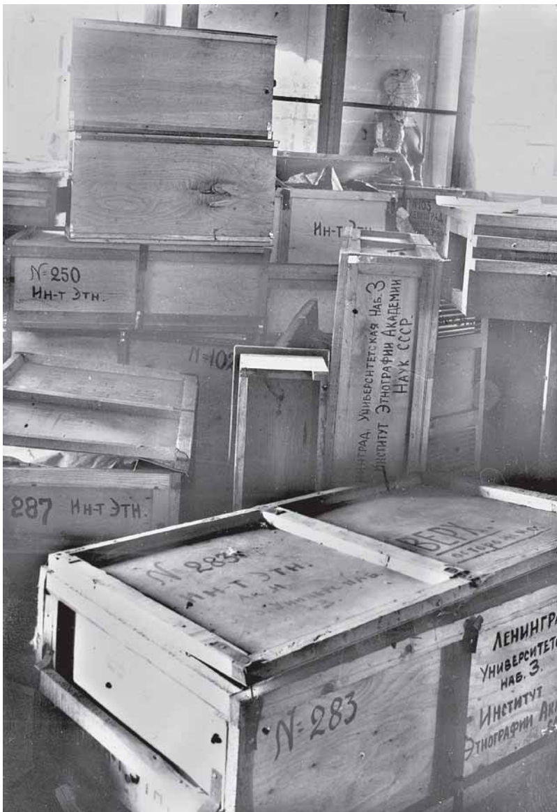
Ящики, подготовленные сотрудниками Института для эвакуации, так и остались в осажденном городе...