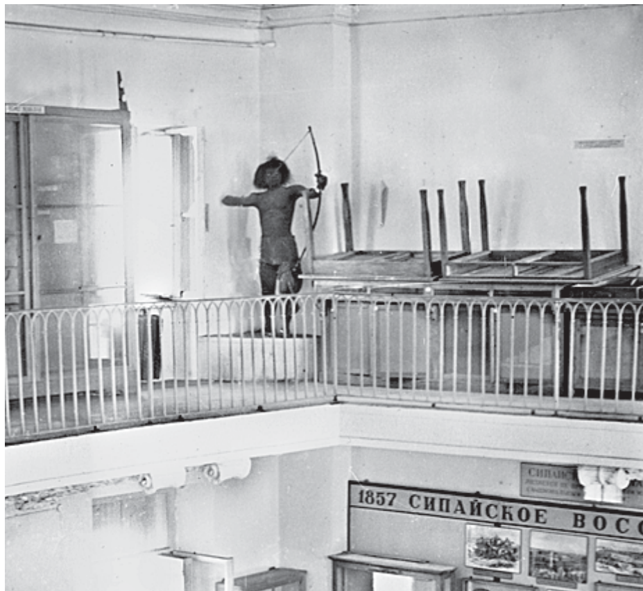
Папуас, «выстреливший» из лука.

перенесли на своих руках в здание Музея, в том числе и на верхние этажи. Каменные плиты мы установили в проемах окон, заделали кирпичом, оставив амбразуры для пулеметов. Для установки пулеметов построили специальные деревянные постаменты, а для тяжелых орудий пришлось в толстых стенах здания пробивать специальные двери. Нам же пришлось прокладывать и телефонный кабель внутри здания, чтобы в случае необходимости, осуществлять связь с военной частью, дислоцированной в данном районе города.