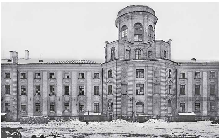
Так выглядело здание Кунсткамеры в годы блокады.

Юрий Воронов. Блокада. Книга стихов. [Лениздат, 1986]