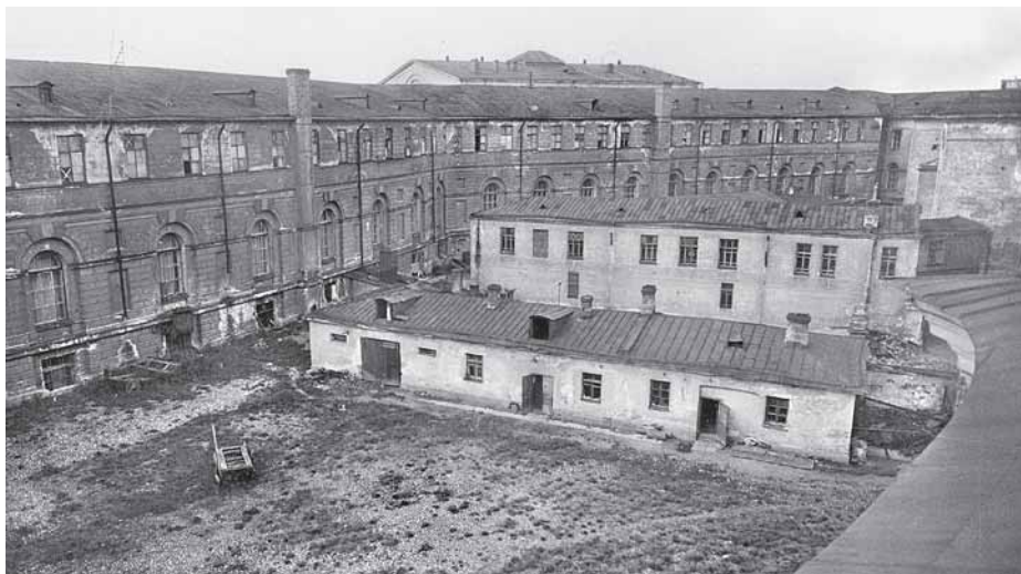
Двор Кунсткамеры, где в сухие солнечные дни пробетривались экспонаты, чтобы в них не забелась моль.