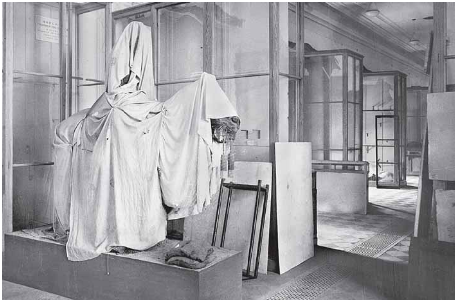
В залах Кунсткамеры: Дальний Восток (вверху), Китай (внизу).