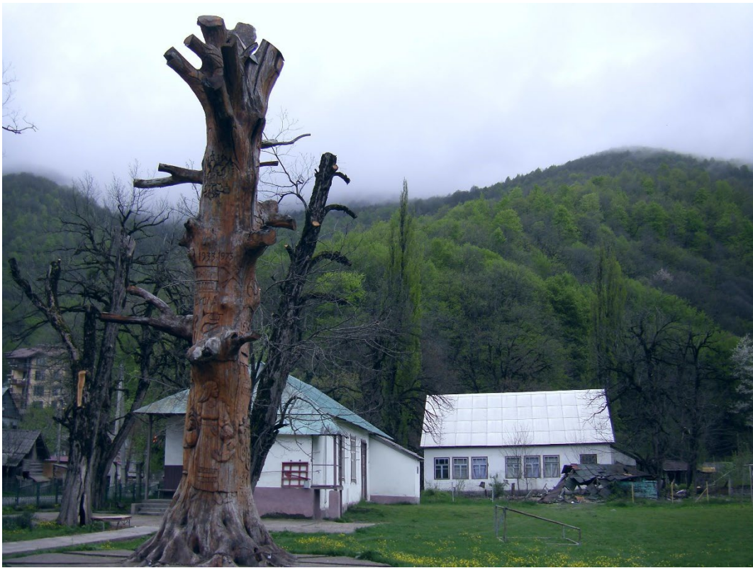
Фото: 3.3.49 «Старый дуб», символ эстонской общины.