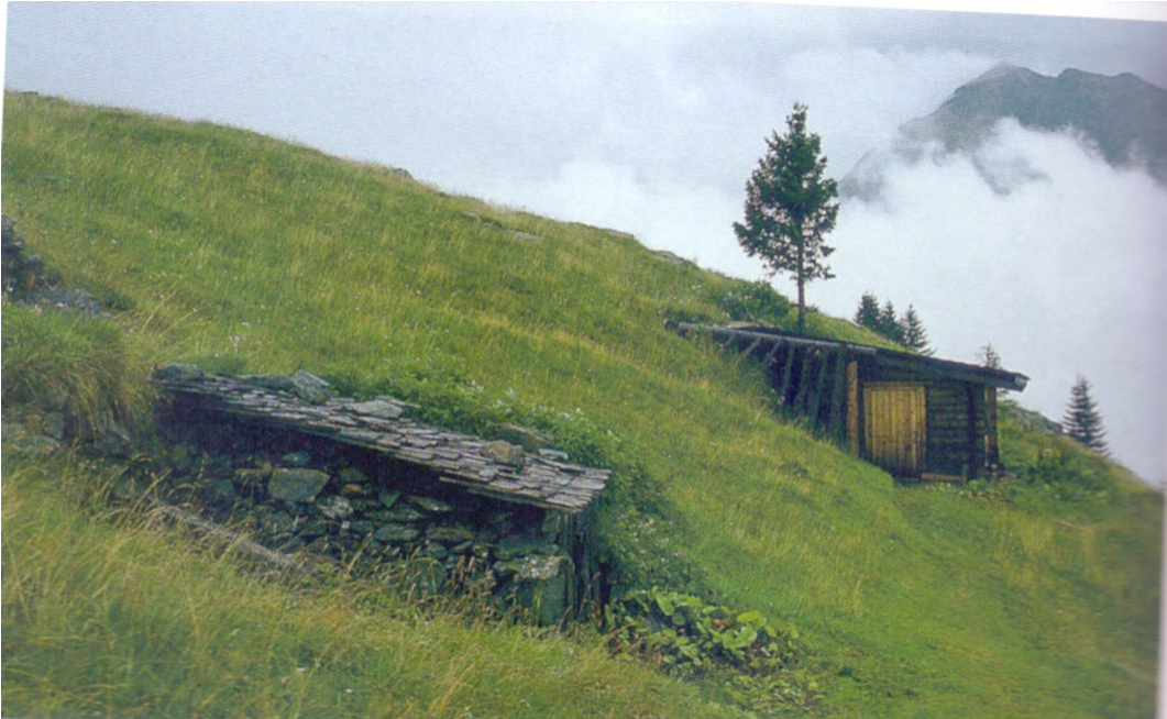
Фото 2.1.4. «Времянки» (Hirten-Unterstand)