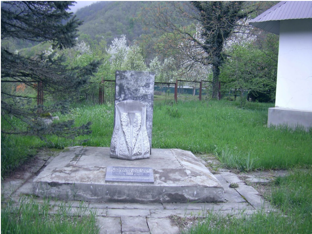
Фото: 3.3.47- 3.3.48 Дом-музей им. А. Х. Таммсааре.