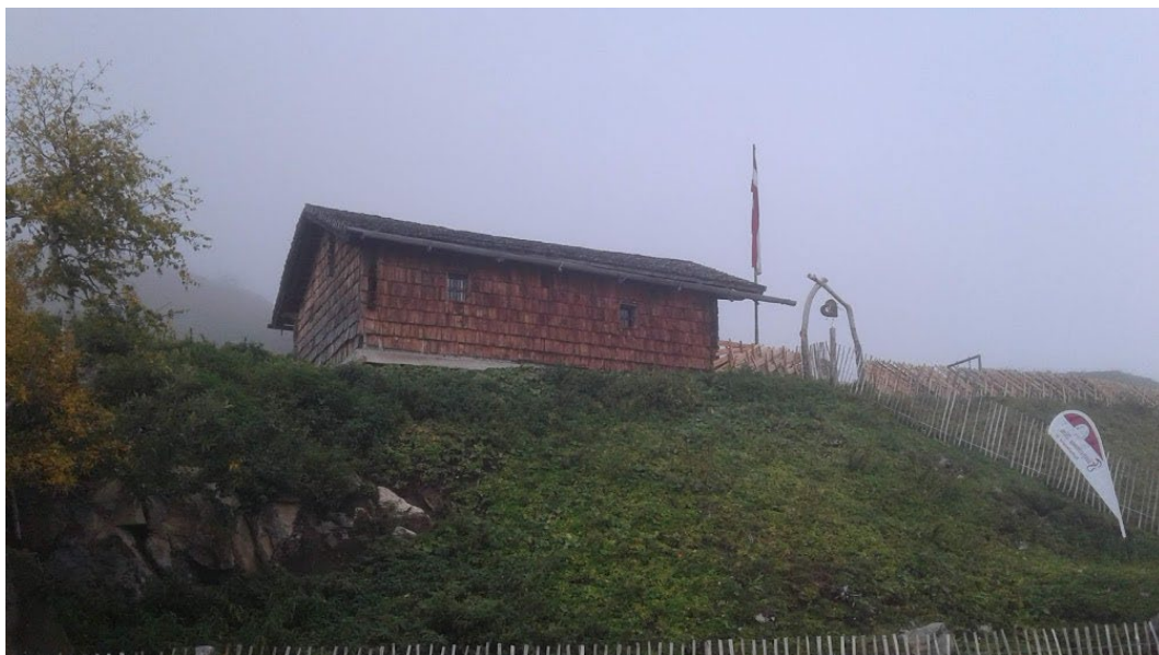
Фото: 2.4.33.-2.4.34., Fürthermoar alm.