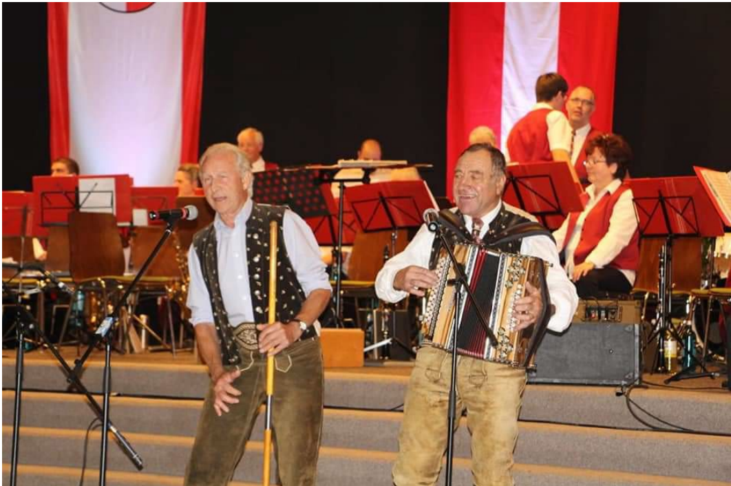
Фото 2.4.19. Выступление представителей общества Kitzstoana