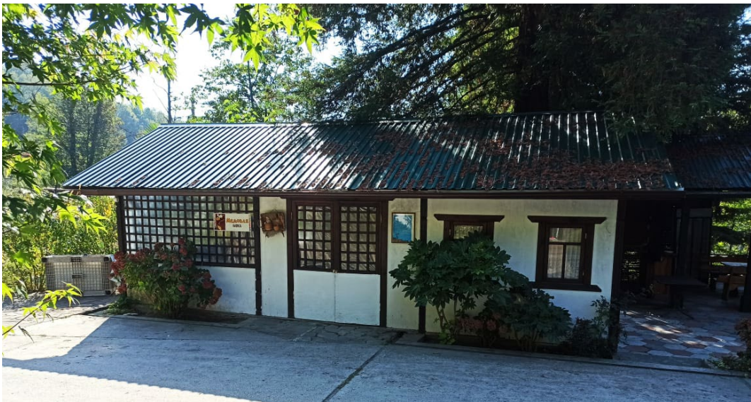
Фото: 3.3.56 – 3.3.58. Этнокомплекс «Вольница», Сочинский национальный парк.