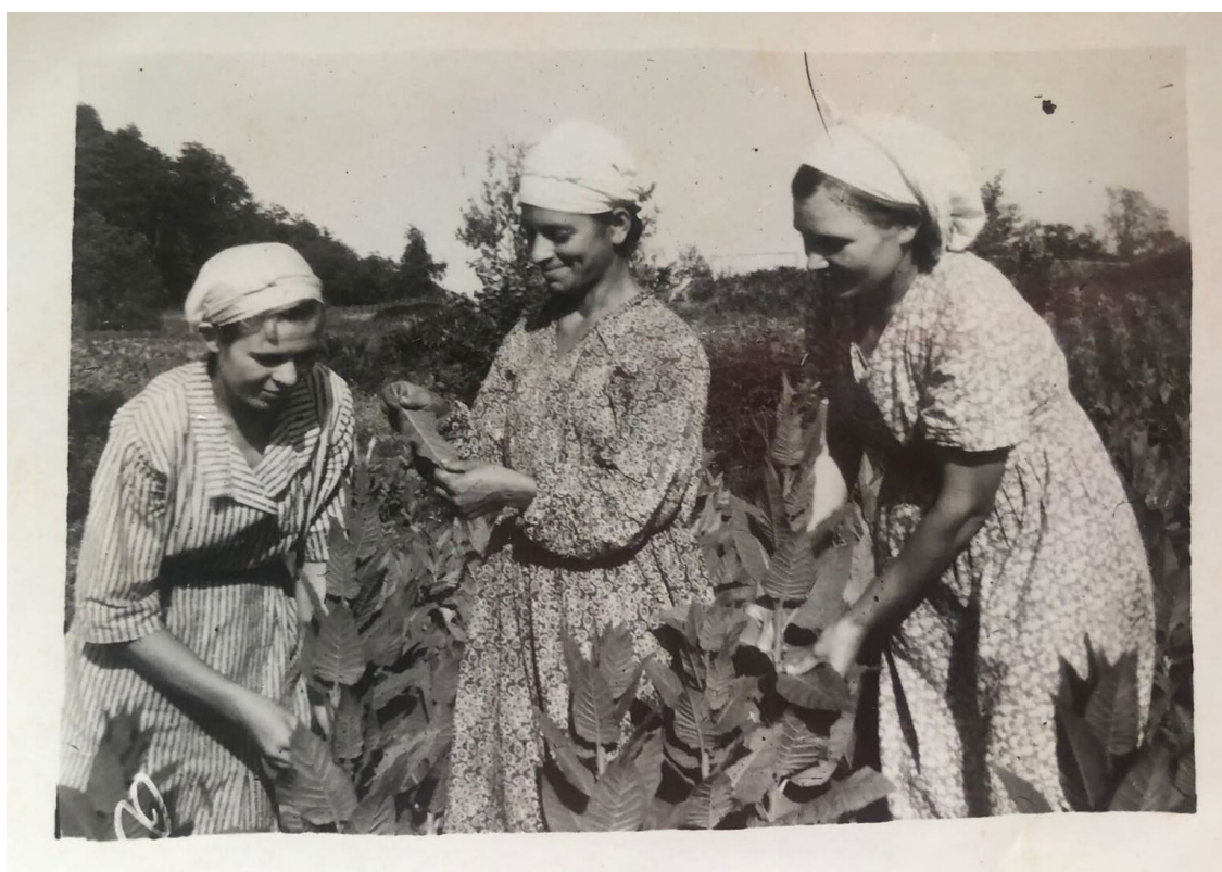
Фото 3.3.81. Жители села Прогресс. Табаководство.