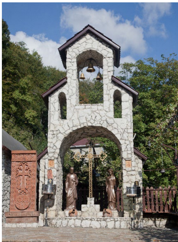
Фото: 3.3.55. Хачкар и часовня.