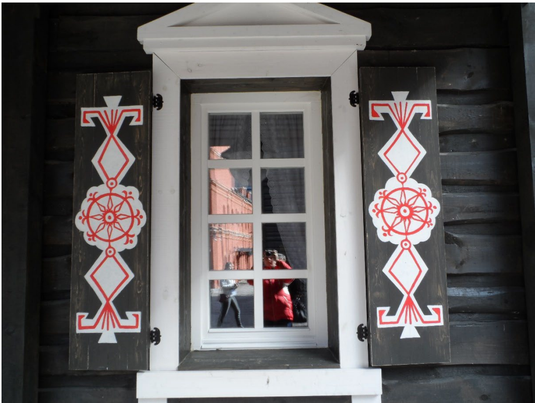
Фото: 3.3.70 – 3.3.71. Этнографический комплекс «Моя Россия». Павильоны.