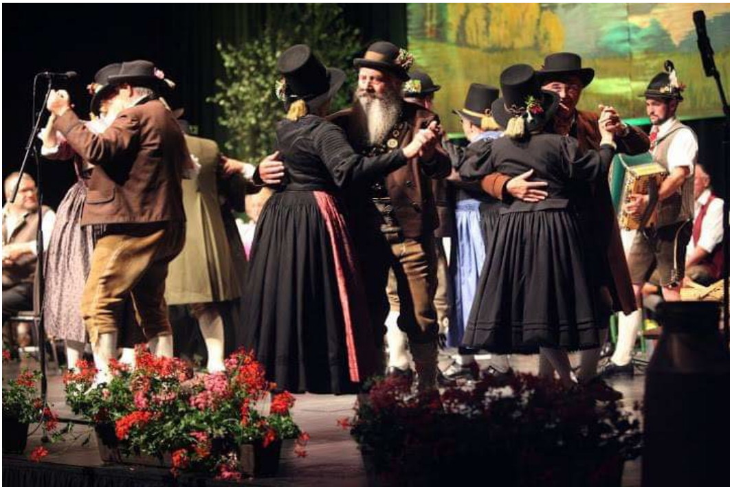
Фото 2.4.20.-2.4.21. Выступление представителей общества Kitzstoana

Взято из: официальная страница общества в Facebook. URL: https://www.facebook.com/kitzstoana