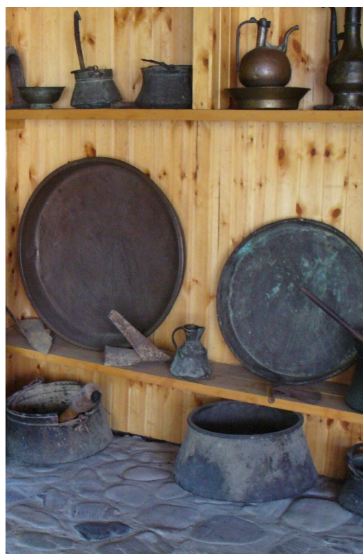
Фото 3.3.89-3.3.90 Этнографический двор семьи Ачмизовых, аул Большой Кичмай.