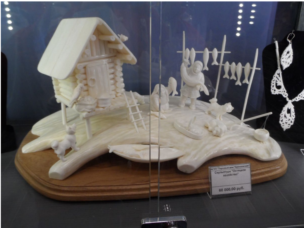
Фото: 3.3.74 – 3.3.75. Этнографический комплекс «Моя Россия». Экспозиция.