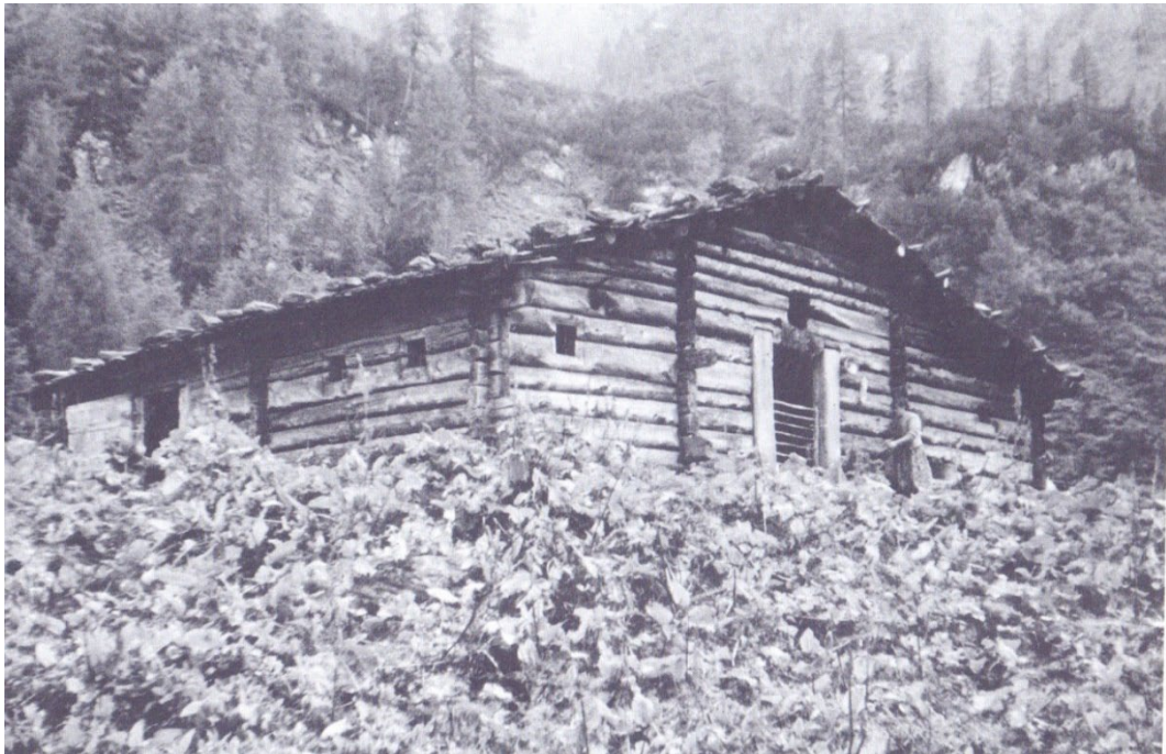
Фото 2.1.5. Хижина (Almhütte), 1961 г.

Взято из: Jungmeier M. Almen – Wissenschaftliche Schriften. Natur, Kultur und Nutzungen. Klagenfurt: Verlag Carintia GmbH & Co KG, 2004. S.46.