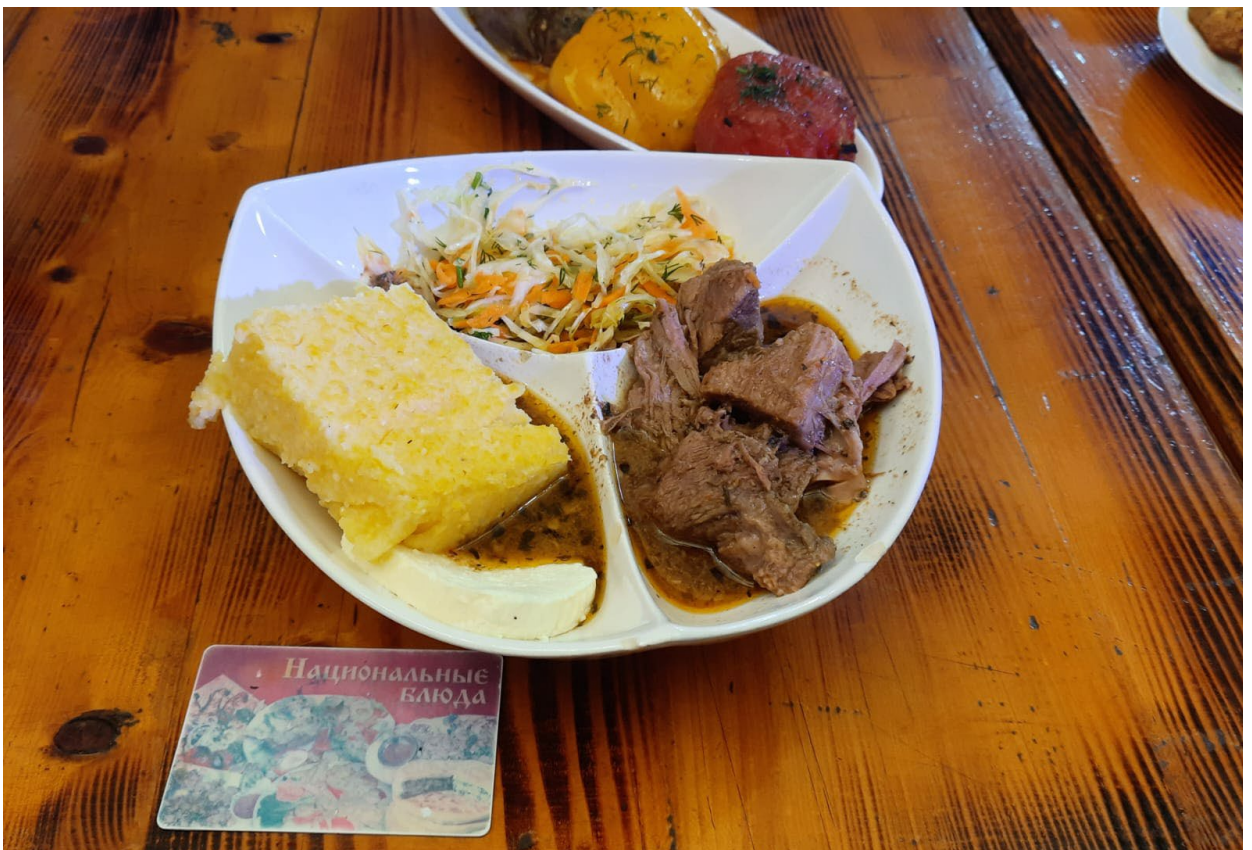
Фото 3.3.96. Лилибж – национальное блюдо адыгов, предлагаемое на этношоу в ауле Большой Кичмай.