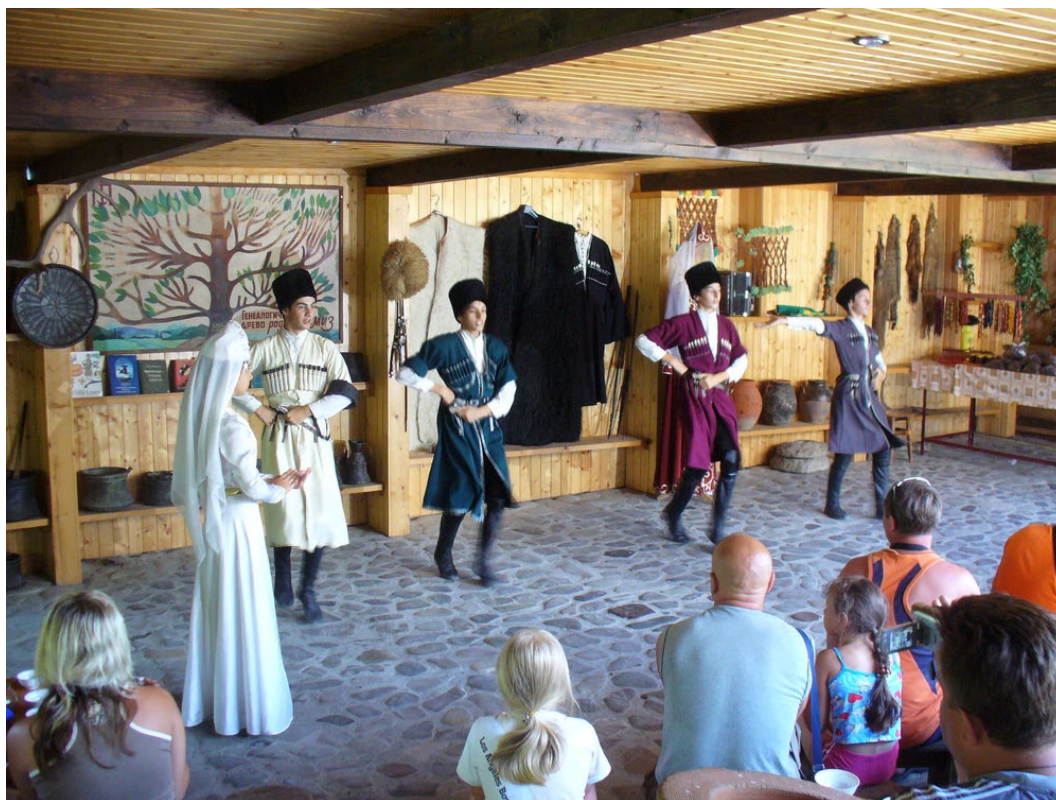
Фото 3.3.88 Этнографический двор семьи Ачмизовых, аул Большой Кичмай.