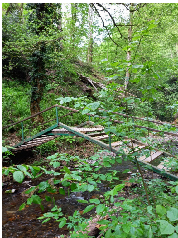
Фото: 3.3.62.- 3.3.65. Этнокомплекс «Вольница», Сочинский национальный парк.