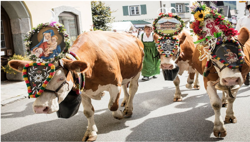
Фото 2.4.8-2.4.9. Крестьянская осень в Раурисе.

Взято из: Raurisertal. URL: https://www.raurisertal.at/de/sommer/events/sommer-highlights/bauernherbst/