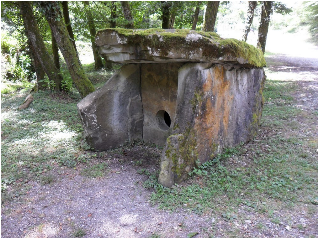
Фото 3.3.92. Адыгское подворье. Аул Большой Кичмай.