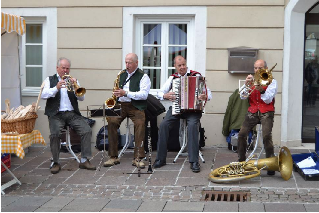
Фото 2.4.18. Выступление местного фольклорного коллектива.