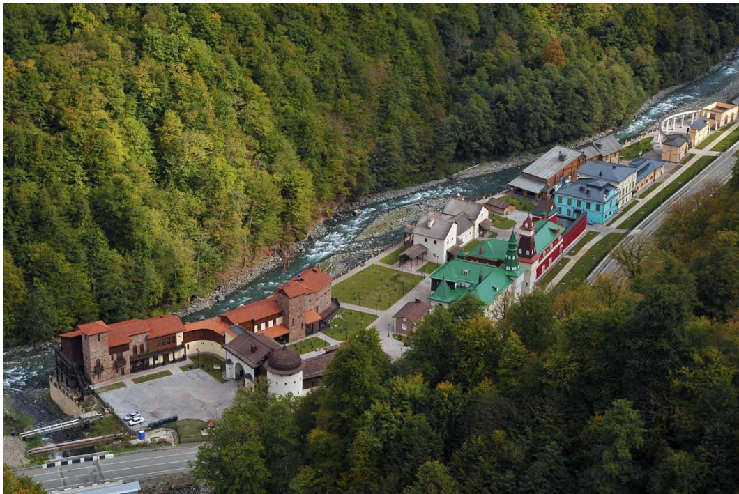
Фото: 3.3.66. Этнографический комплекс «Моя Россия»