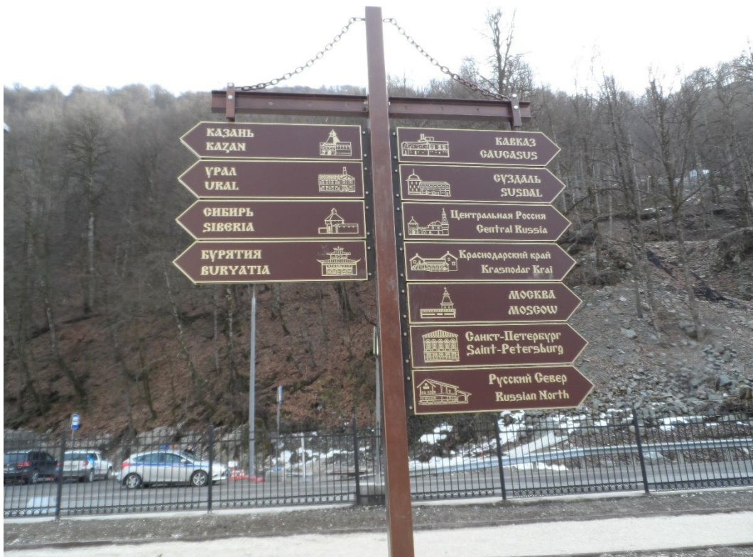
Фото: 3.3.67. Этнографический комплекс «Моя Россия». (Фото П.А.Куринских)

Взято из: Этнографический комплекс "Моя Россия" передан в управление курорта "Роза Хутор" // Сергей Бачин. URL: https://twitter.com/sergey_bachin/status/1186566039619985408/photo/1