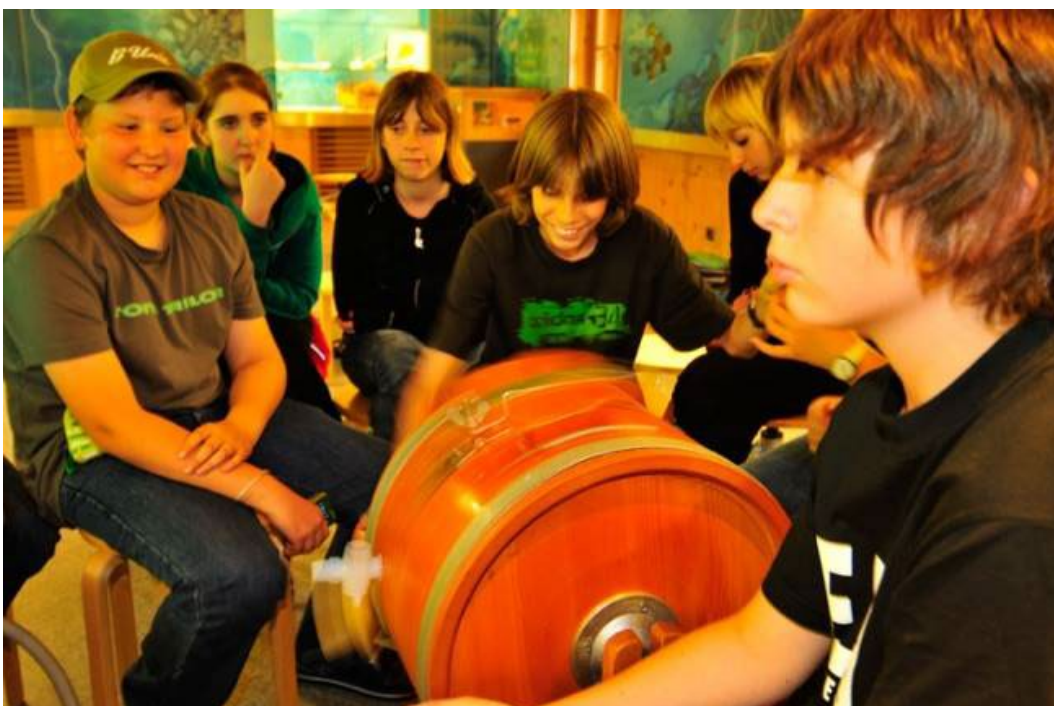
Фото 2.3.7. Мастерские при национальном парке «Высокий Тауэрн»