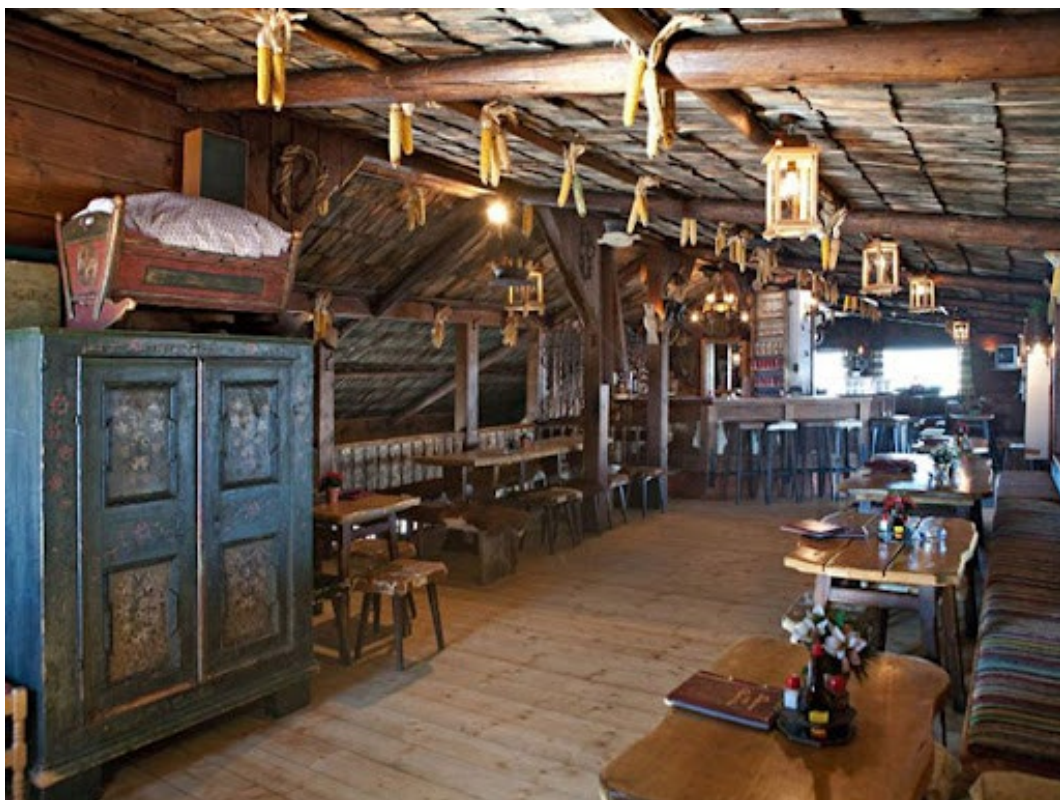
Фото 2.5.23. Интерьер Hochzeller Alm.