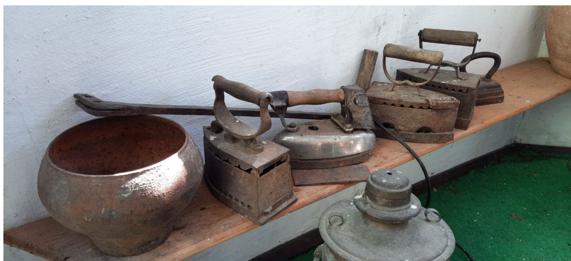
Фото: 3.3.59 – 3.3.61. Этнокомплекс «Вольница», Сочинский национальный парк.