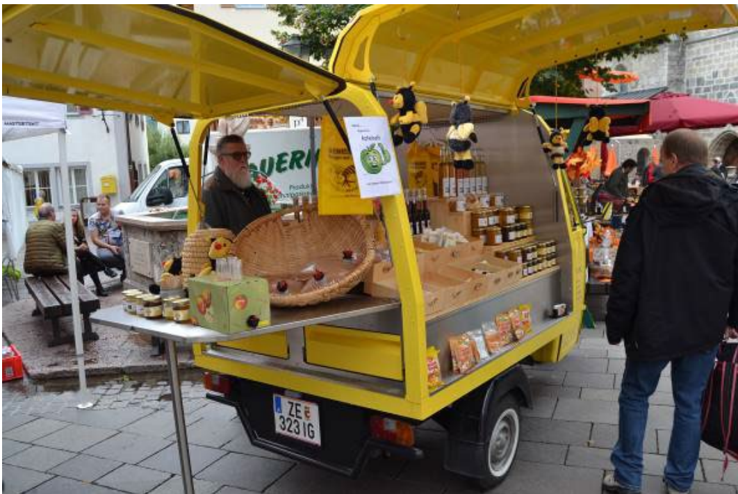
Фото 2.4.13. Одна из торговых точек ярмарки.