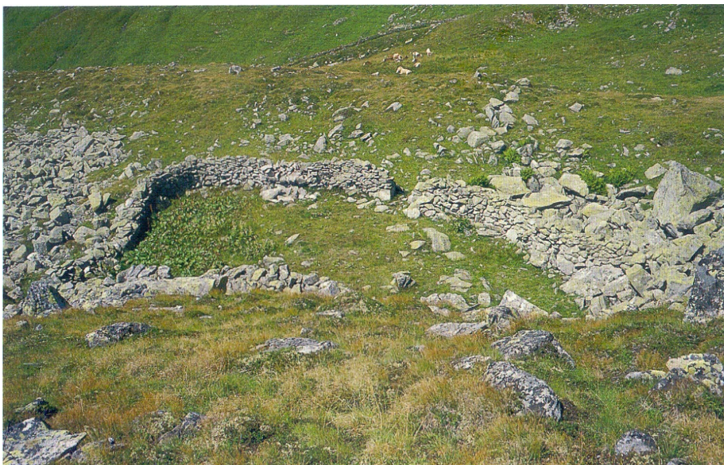
Фото 2.1.6. Каменный загон – пфренгер (Pfrenger)

Взято из: Jungmeier M. Almen – Wissenschaftliche Schriften. Natur, Kultur und Nutzungen. Klagenfurt: Verlag Carintia GmbH & Co KG, 2004. S. 112.