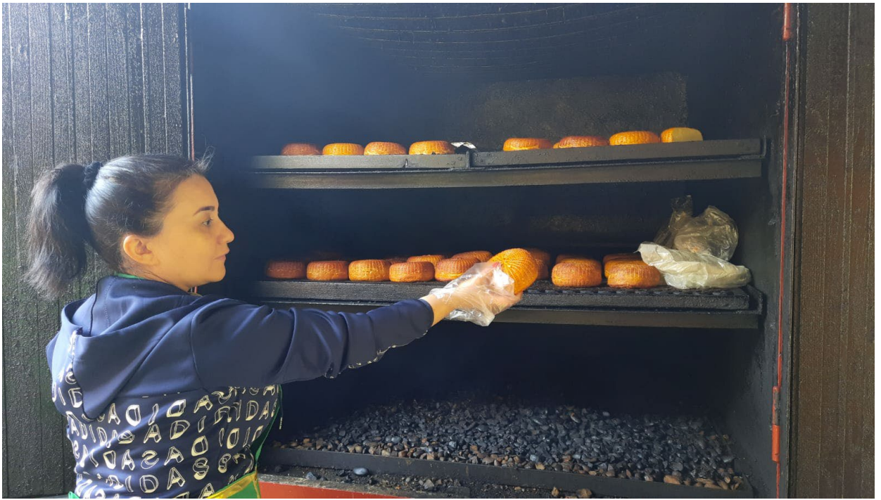
Фото 3.3.95. Сыроварня, аул Большой Кичмай.