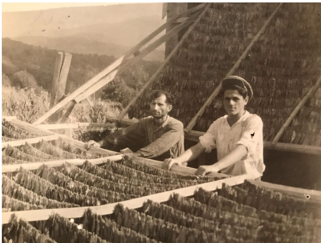
Фото 3.3.80. Жители села Прогресс