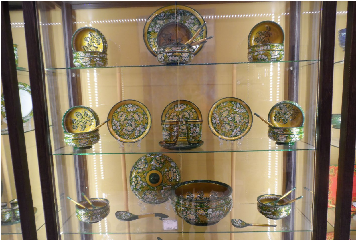
Фото: 3.3.72 – 3.3.73. Этнографический комплекс «Моя Россия». Экспозиция.