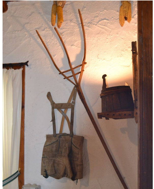
Фото: 2.4.24.-2.4.26. Элементы интерьера Hochzeller Alm.