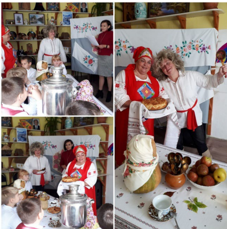
Фото 3.3.43 Проведение мероприятия среди школьников «Традиции русских осенних посиделок»