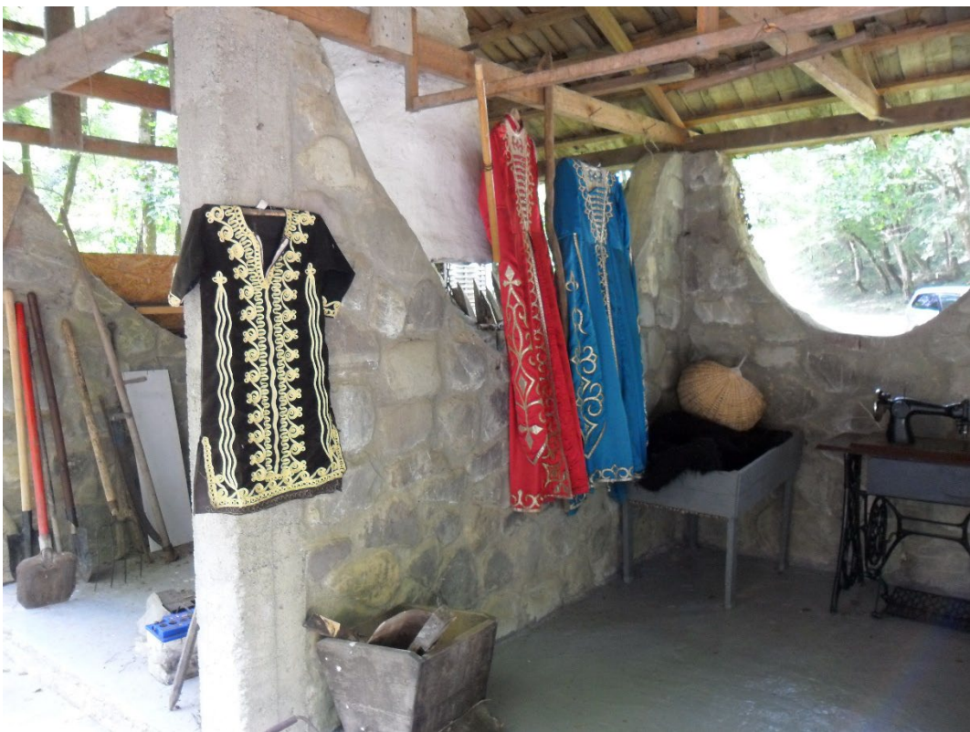
Фото 3.3.94. Адыгское подворье. Аул Большой Кичмай.