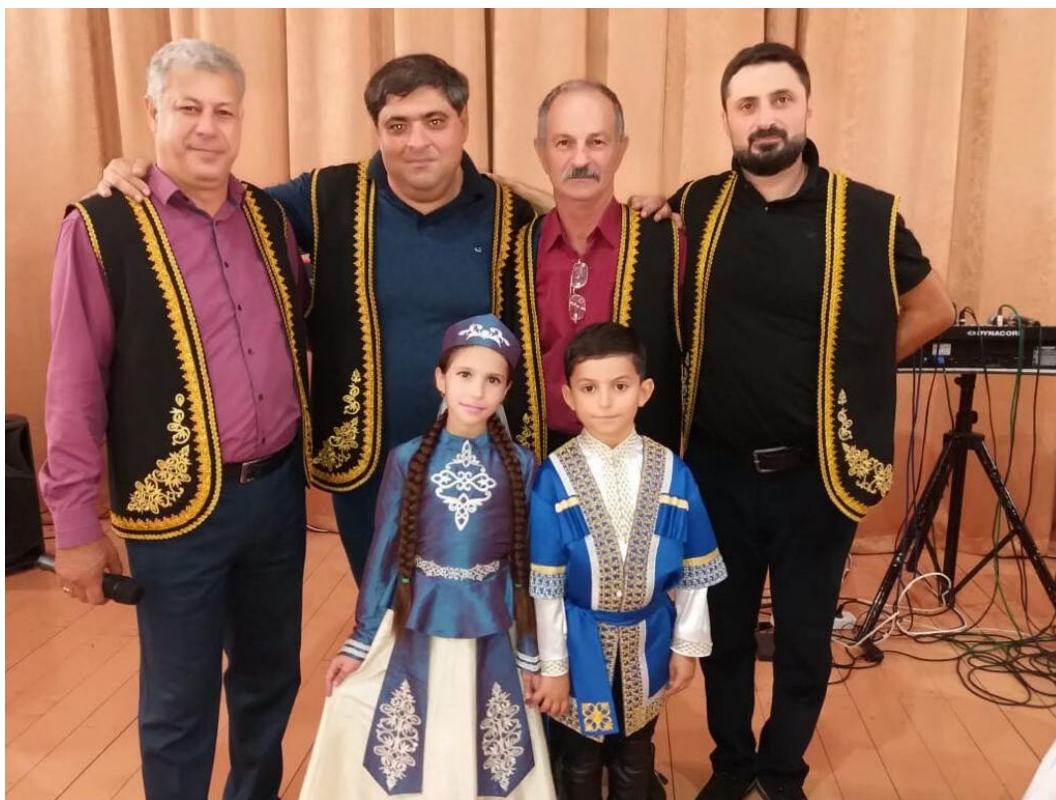
Фото 3.3.78. Хореографический ансамбль «Гюмри»