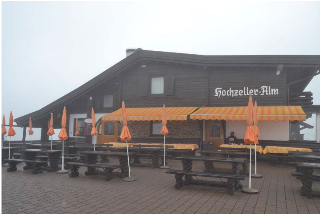
Фото: 2.4.22., Hochzeller Alm: охотничий домик, переоборудованный под ресторан локальной кухни.