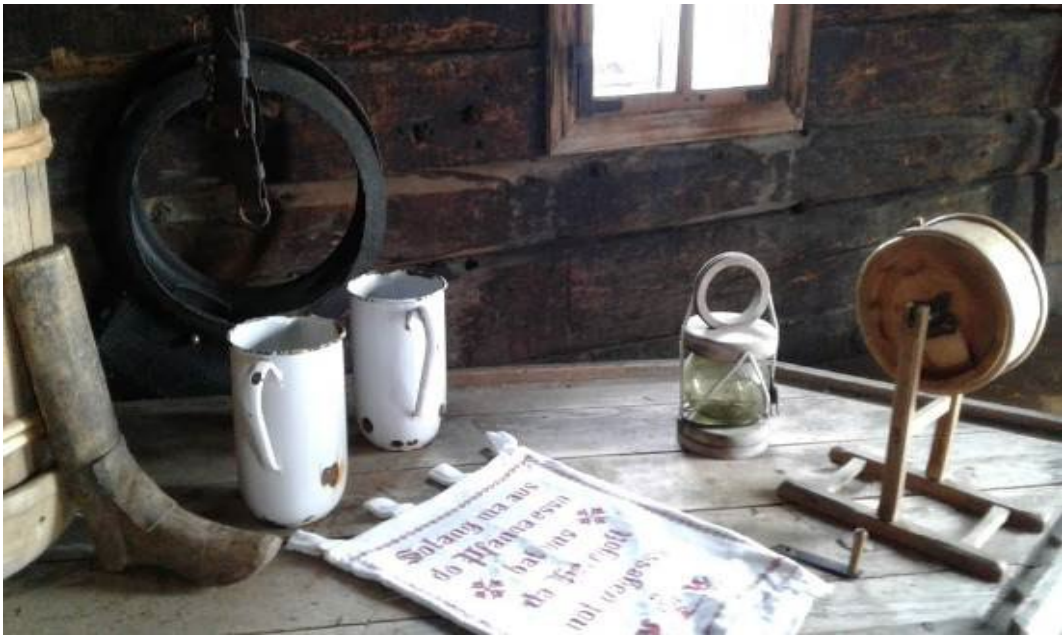
Фото: 2.4.37-2.4.38., Fürthermoar alm.