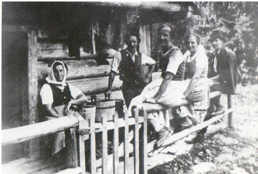
Фото 2.1.1. Альпийские пастухи и пастушки, занимавшиеся переработкой молока в масло и сыр (Senner, Sennerin), 1920 г.