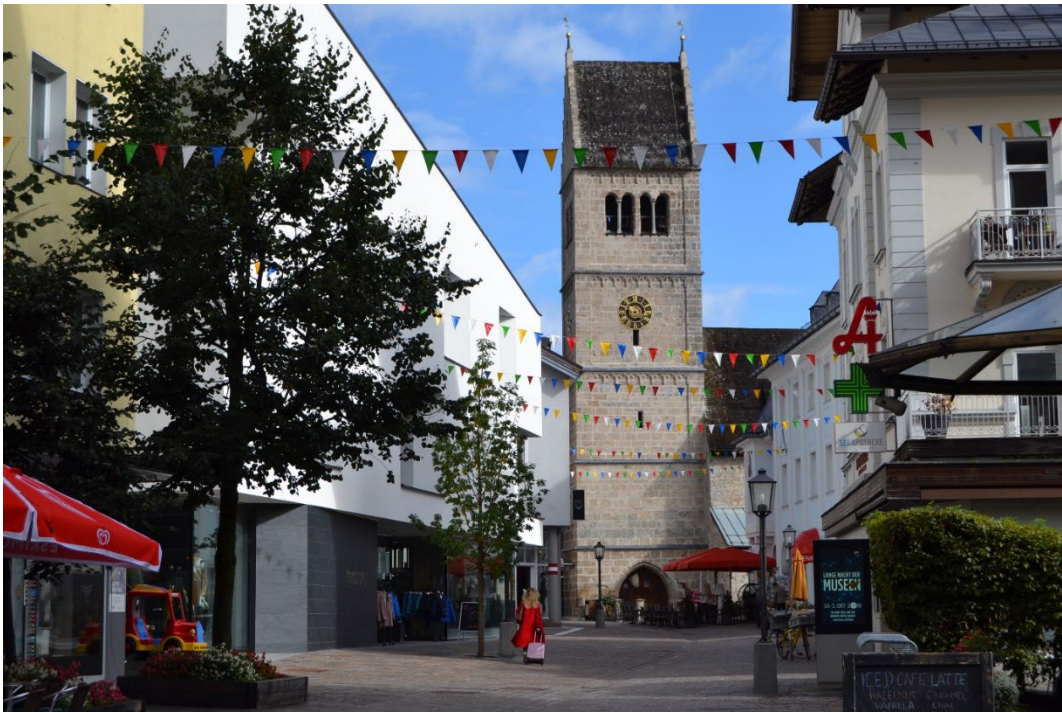
Фото 2.4.10 Городская площадь, Цель-ам-Зее.