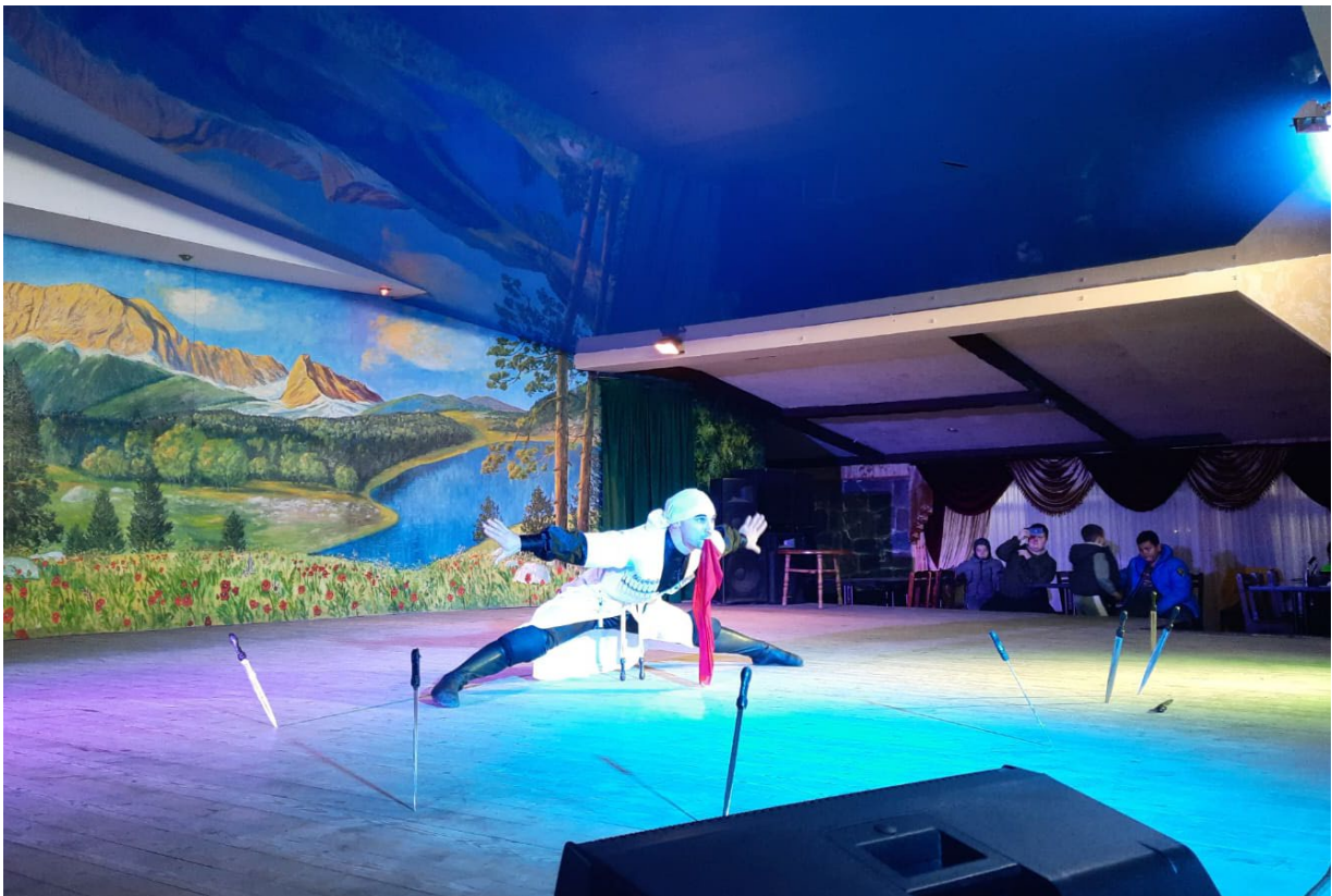
Фото 3.3.97-3.3.98. Этношоу в аule Большой Кичмай.