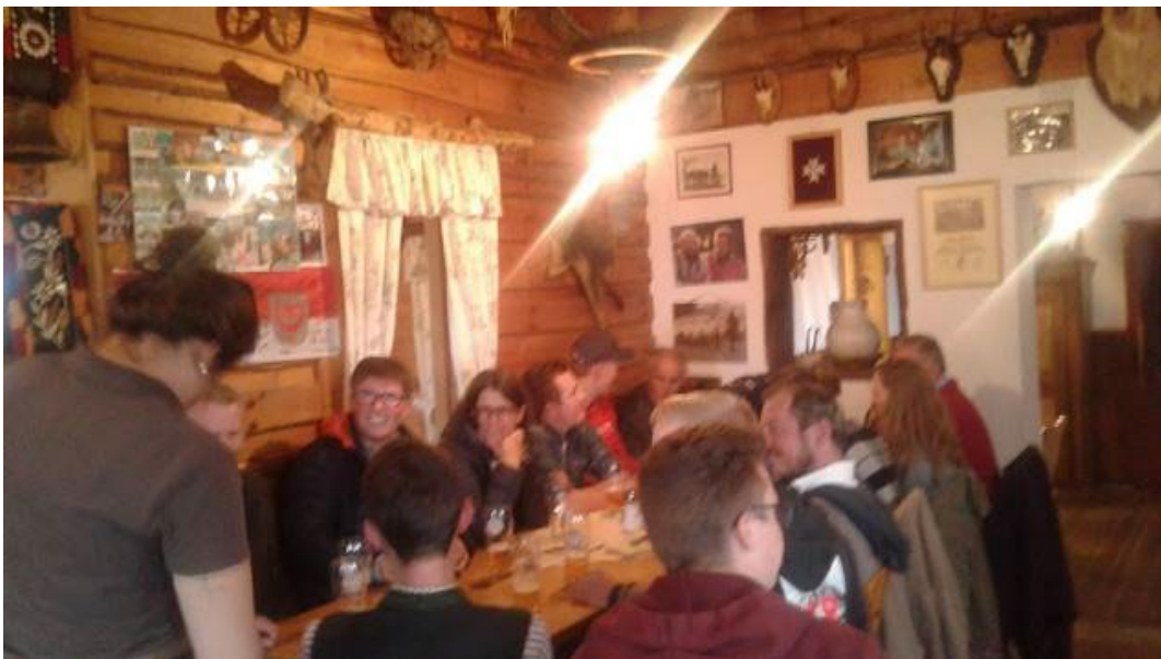
Фото: 2.4.39.-2.4.40., Fürthermoar alm.