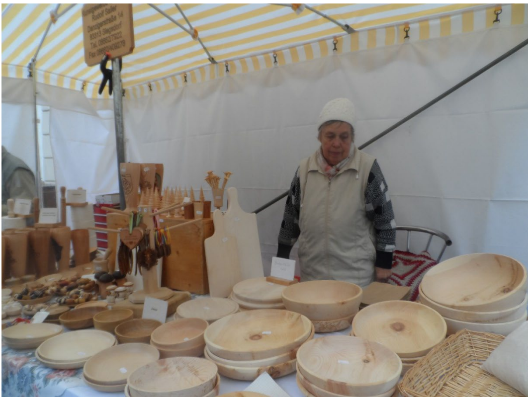
Фото 2.4.16-2.4.17. Продукция городской ярмарки.