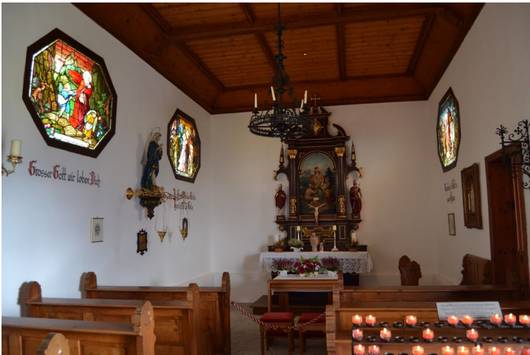
Фото: 2.4.27.-2.4.28., Часовня Елизаветы (Elisabethkapelle).