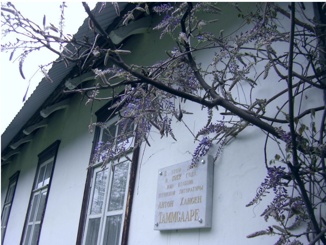
Дом-музей им. А. Х. Таммсааре.