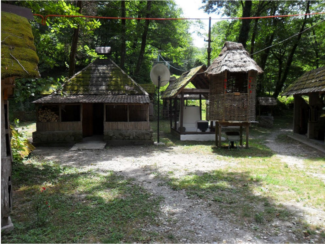
Фото 3.3.91. Адыгское подворье. А. Большой Кичмай.