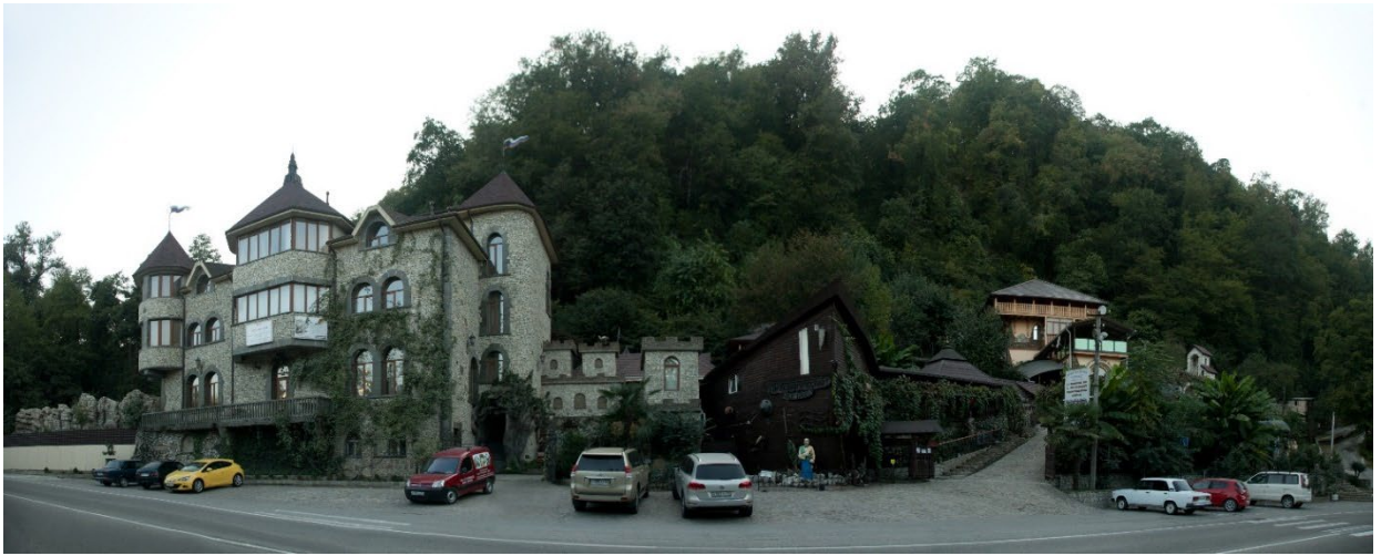
Фото: 3.3.51. «Амшенский двор». Панорама.