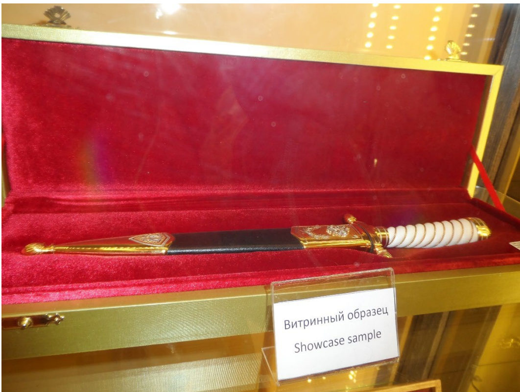
Фото: 3.3.76 – 3.3.77. Этнографический комплекс «Моя Россия». Экспозиция.