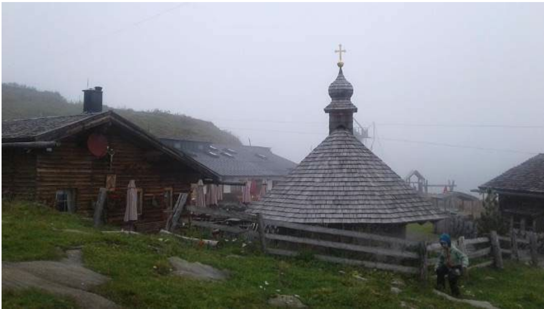
2.4.29.-2.4.30., Fürthermoar alm.