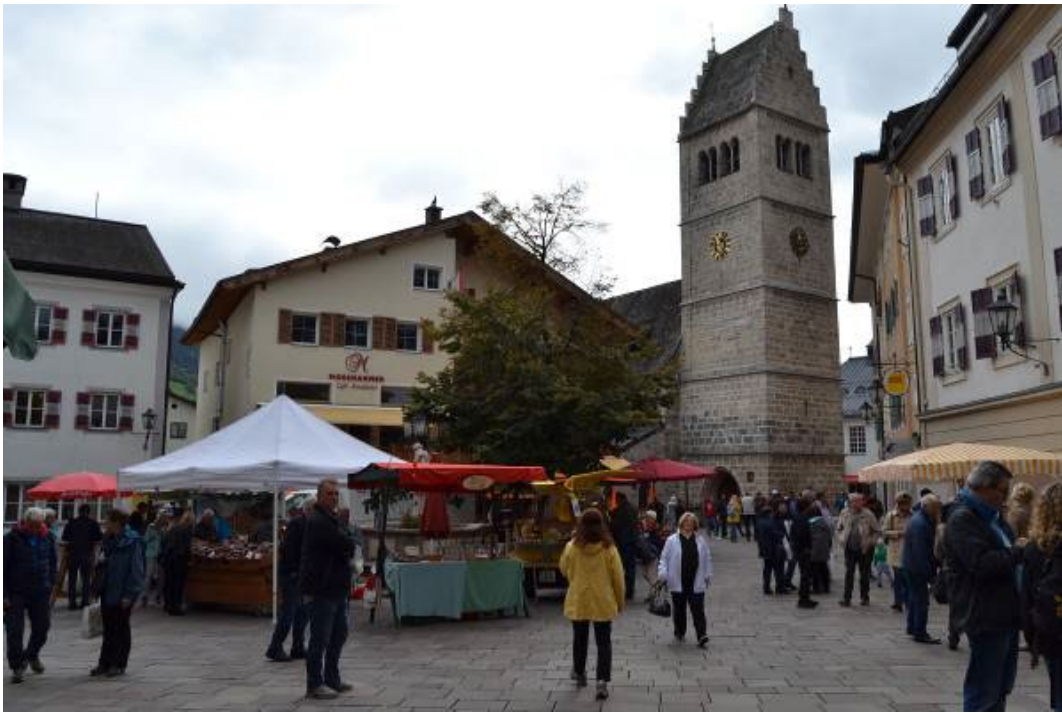
Фото 2.4.12. Ярмарка на городской площади, Цель-ам-Зее.