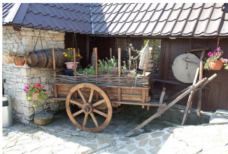
Фото: 3.3.54. Амшенский двор. Детали.