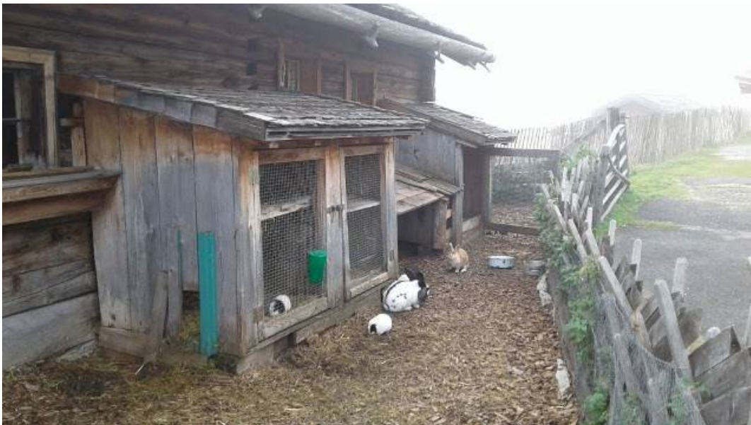
Фото: 2.4.35-2.4.36. Fürthermoar alm.