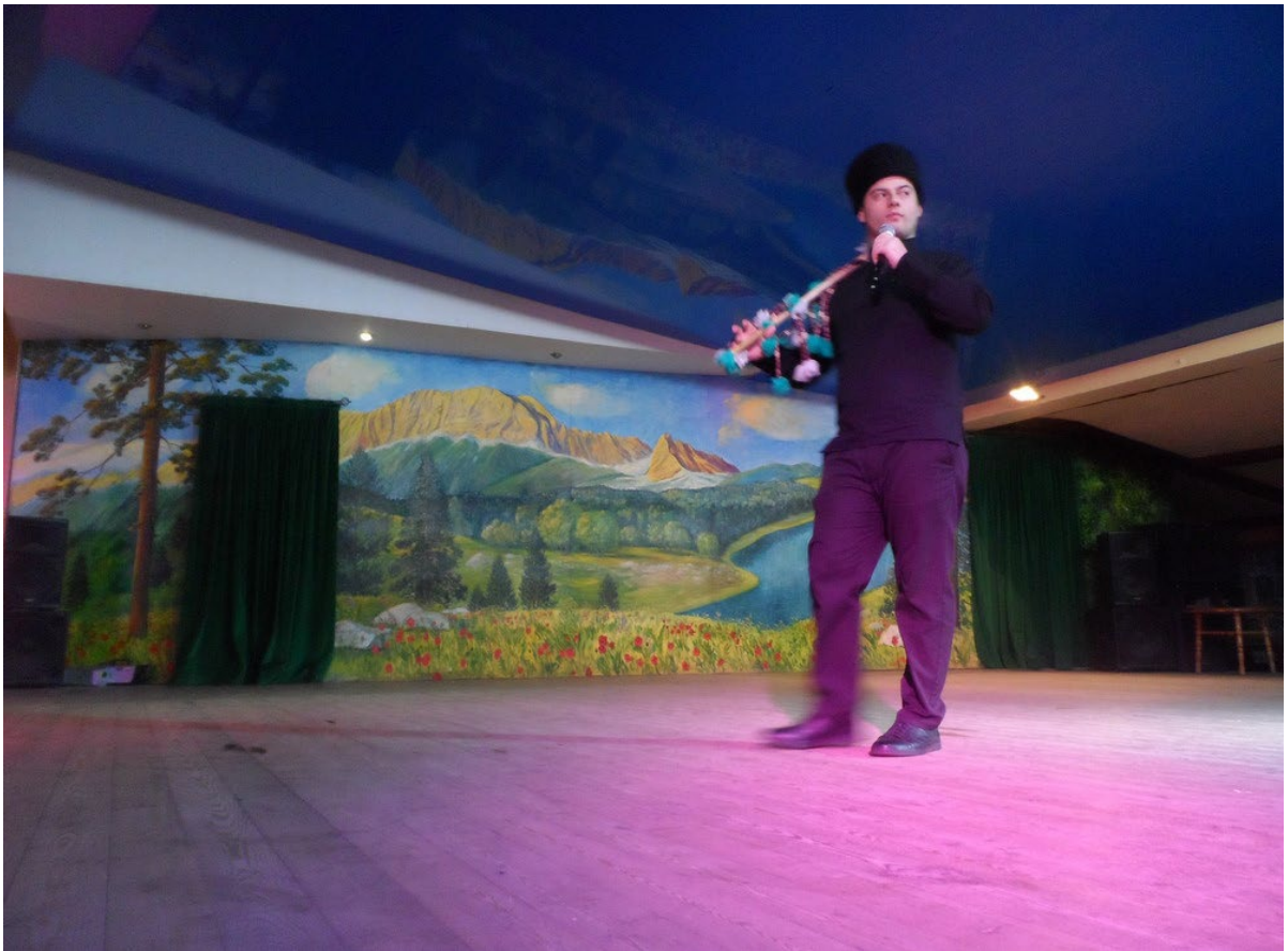
Фото 3.3.99-3.3.100. Этношоу в аule Большой Кичмай.