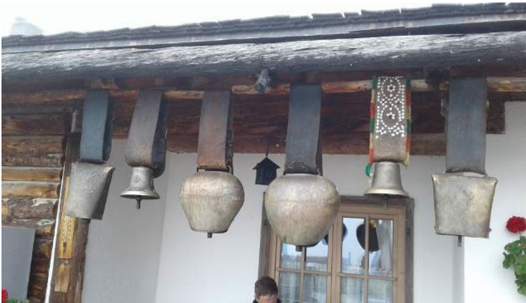
Фото: 2.4.41., 2.4.42. Fürthermoar alm.