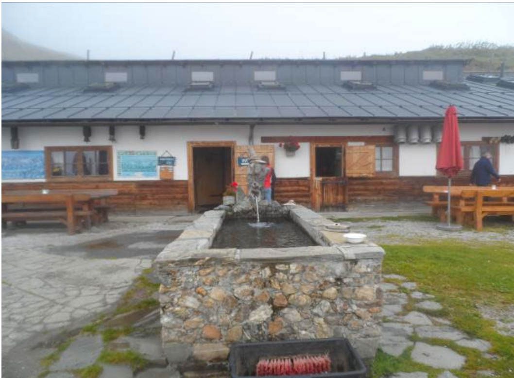
Фото: 2.4.31, 2.4.32. Fürthermoar alm.