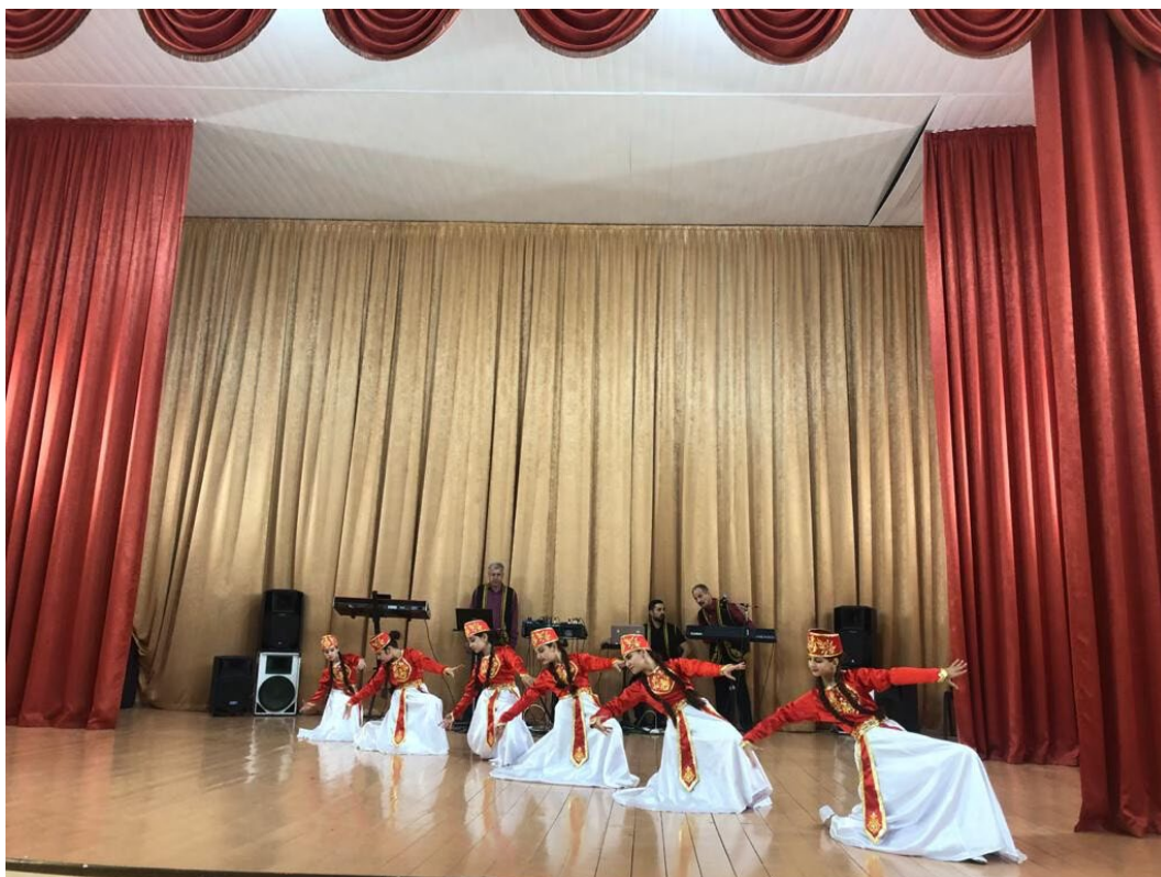
Фото 3.3.79. Хореографический ансамбль «Гюмри»