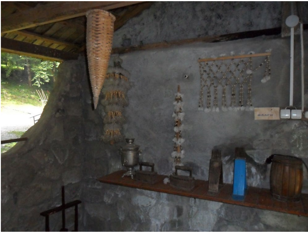
Фото 3.3.93. Адыгское подворье. А. Большой Кичмай.