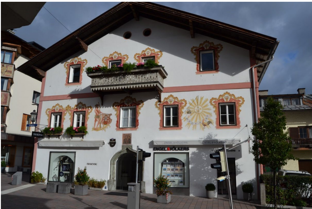
Фото: 2.4.11 Одно из зданий «Старого города», постройка 1493 г.