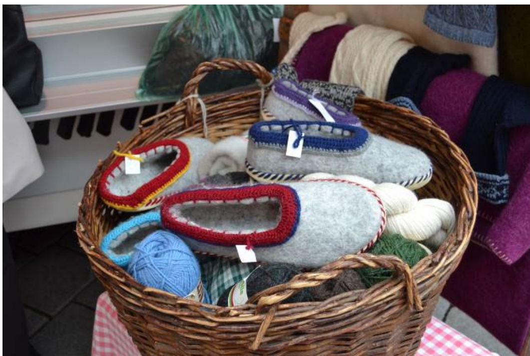
Фото 2.4.14-2.4.15 Продукция городской ярмарки.