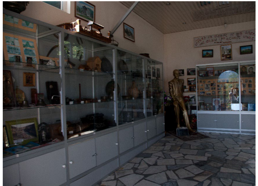
Фото: 3.3.52- 3.3.53. Этнографический музей комплекса «Амшенский двор».