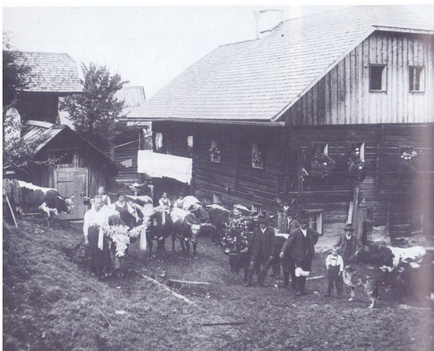
Фото 2.1.1. Альпийские пастухи и пастушки, занимавшиеся переработкой молока в масло и сыр (Senner, Sennerin), 1920 г.