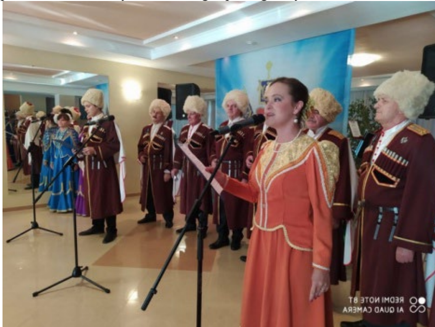
Фото: 3.3.44. День кубанского казачества и Покрова Пресвятой Богородицы