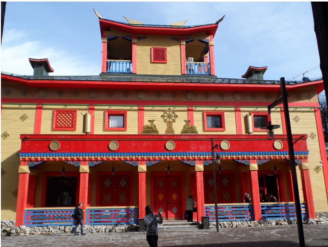
Фото: 3.3.68 – 3.3.69. Этнографический комплекс «Моя Россия». Павильоны.