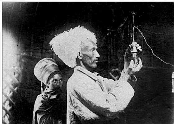
Рис. 9. Освещение юрты. МАЭ.