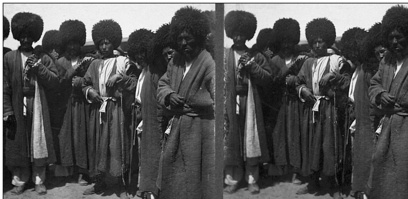
Рис. 13. Мерв. Группа туркменов. МАЭ.