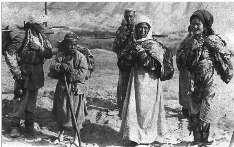
Рис. 12. Горные таджики в пешем походе. МАЭ.