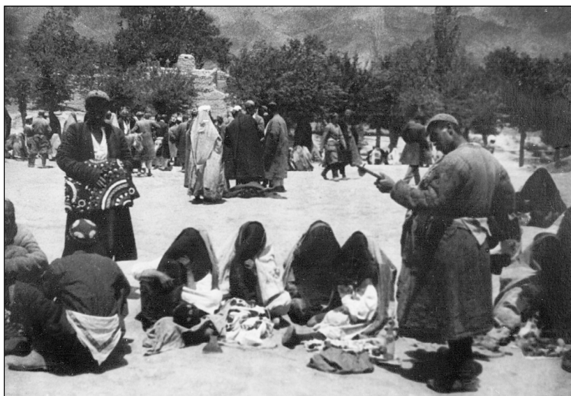
Рис. 8. Базар в Ленинабаде. 1932 г. МАЭ.