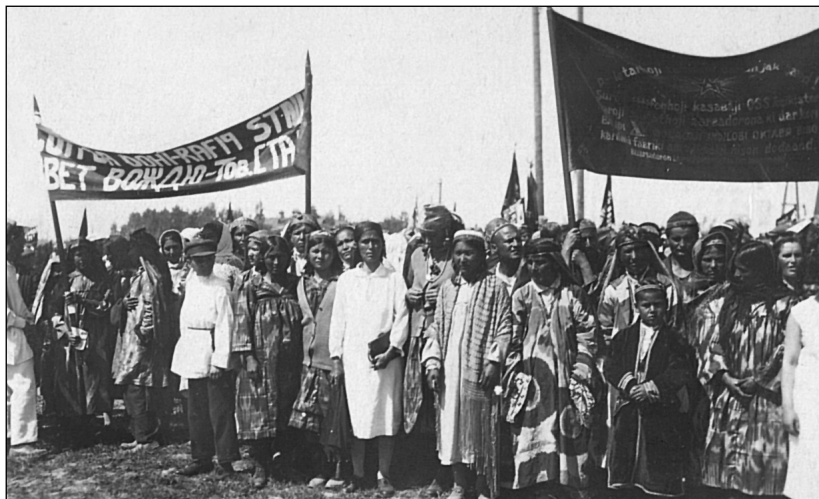
Рис. 3. Демонстрация в г. Сталинабаде в Октябрьские дни 1935 г. МАЭ.