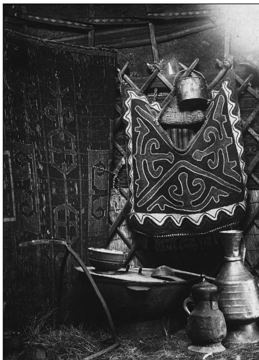
Рис. 6. Убранство богатой юрты днем. МАЭ.