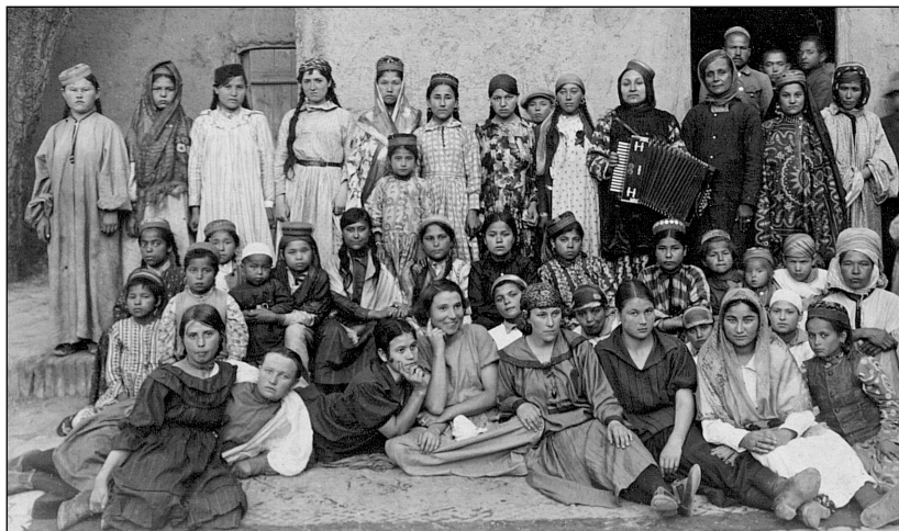
Рис. 15. Первый женский съезд, 1923 г.