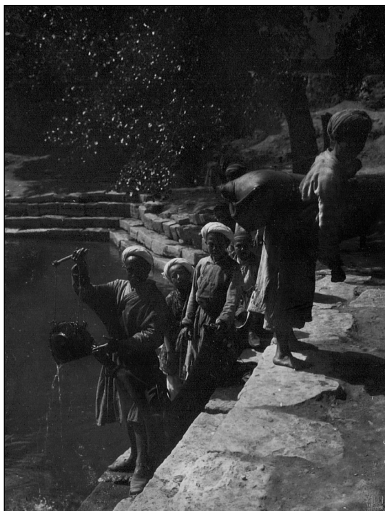
Рис. 16. Бухара. Водоносы. МАЭ.