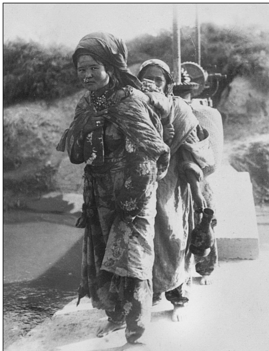
Рис. 11. Молодые женщины-колхозницы на Вахше. 1935 г.