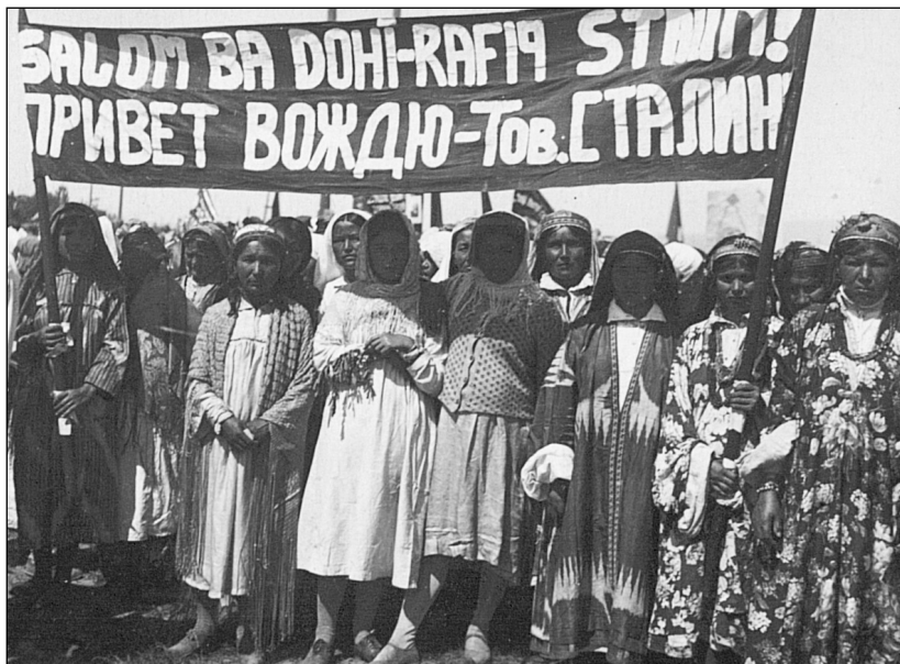
Рис. 4. Работницы шелкомотальной фабрики на демонстрации 1 Мая, г. Сталинабад, 1936 г.