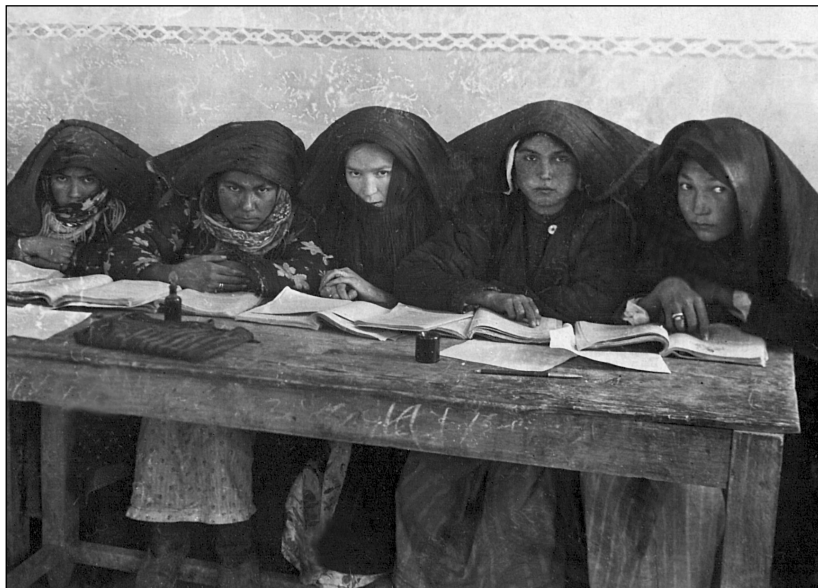
Рис. 7. Колхозная школа в колхозе «Кзыл-Амач».