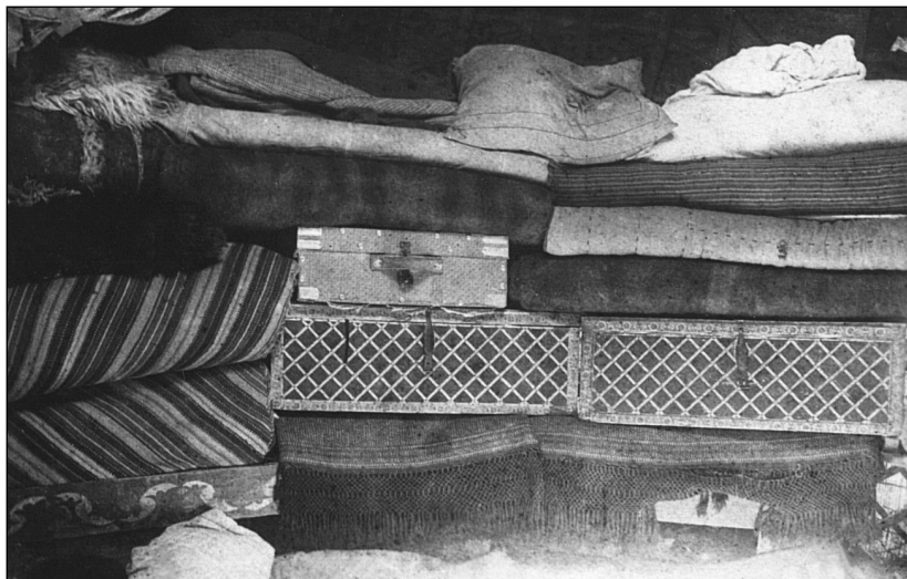
Рис. 5. Уголок юрты. МАЭ.