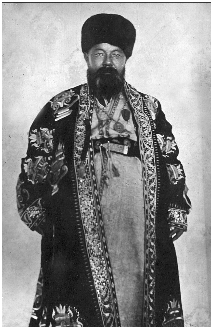
Рис. 17. Волостной Актюбинский управитель в парадной одежде. МАЭ.