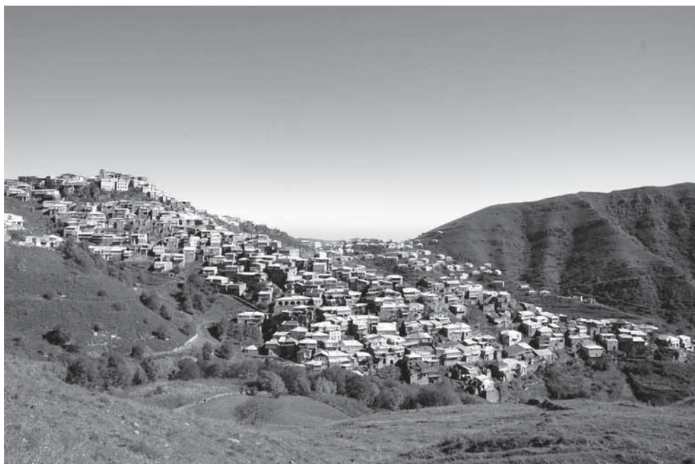
Рис. 1. Вид на с. Кубачи.