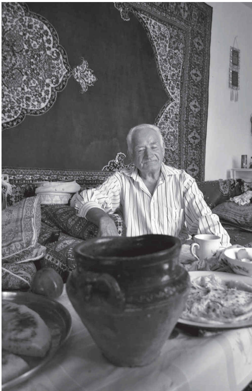
Рис. 5. В домах пожилых сельчан еще можно найти сулевкентские гончарные изделия.