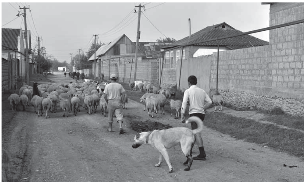
Рис. 4. Улица нового Сулевкента.