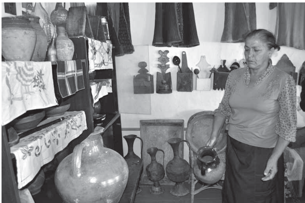
Рис. 6. В музее сулевкентской школы.