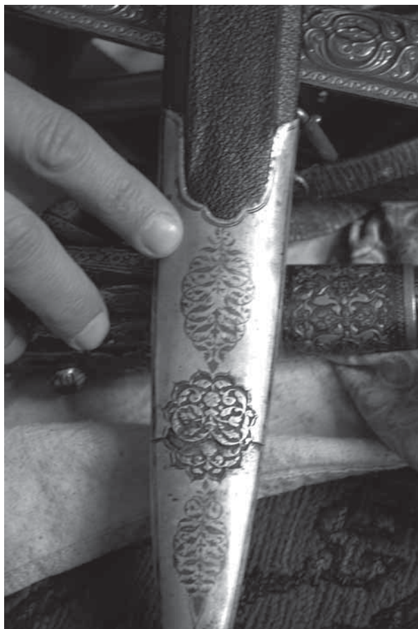
Рис. 3. Кубачинская работа.