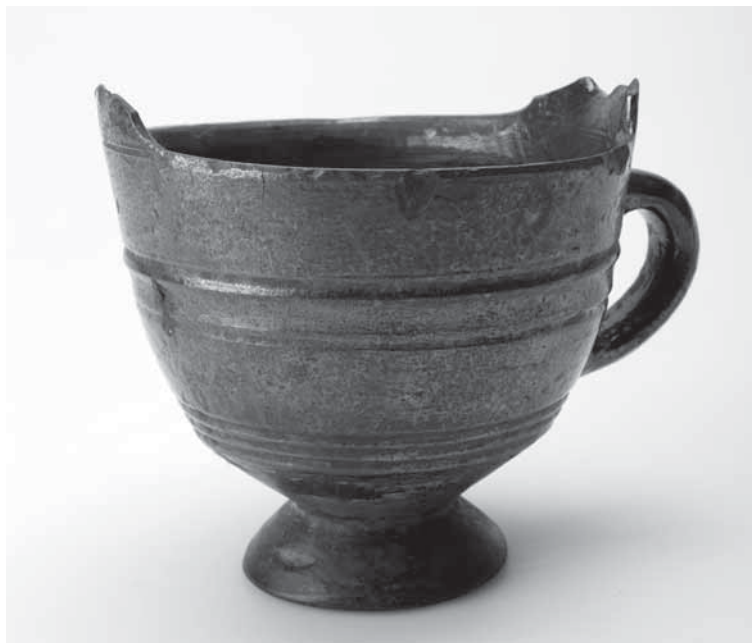
Рис. 10. Чашка работы неизвестного сулевкентского мастера. Из собраний МАЭ РАН, № 7544-1.