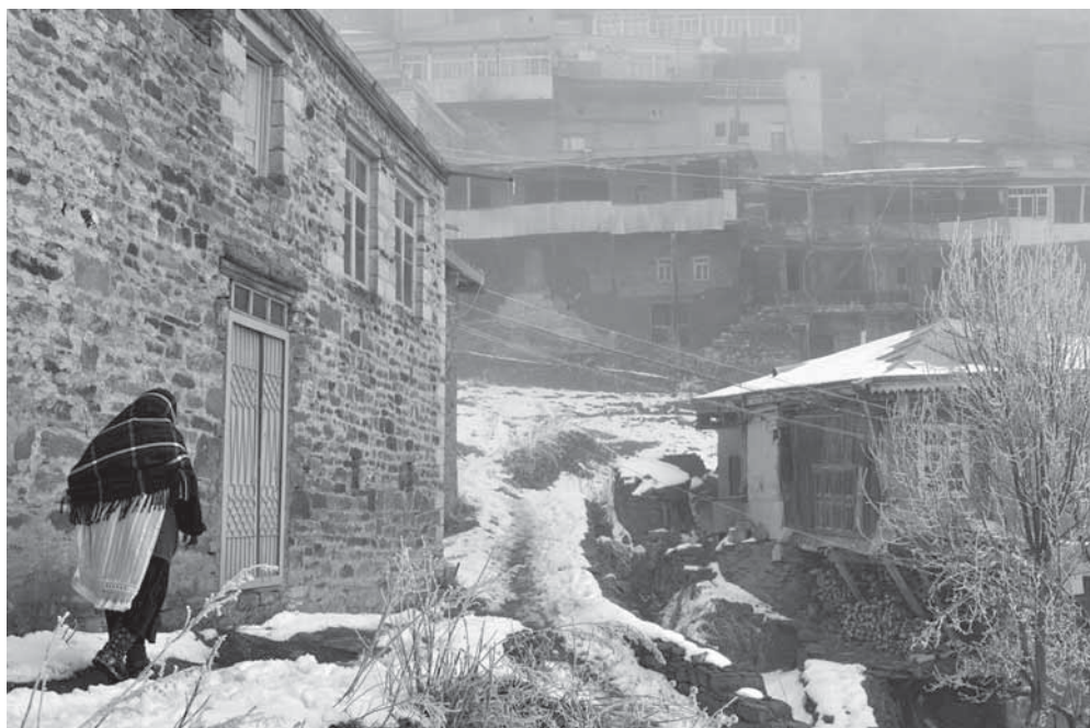
Рис. 12. Кубачи и сейчас в какой-то мере сохраняет облик старого горного селения.