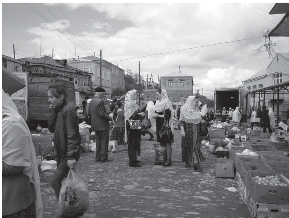
Рис. 2. Летом в горном селе встречаются кубачинцы, приехавшие из разных мест повидать родственников.