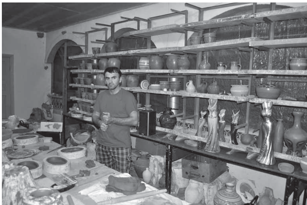
Рис. 8. Мастерская Р. Шахбанова — попытка возрождения гончарного промысла в Сулевкенте.