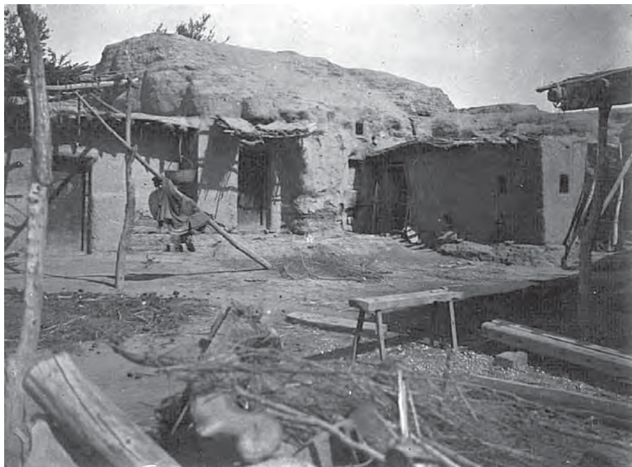
Рис. 5. Китайское жилище, устроенное на развалинах стен древней столицы уйгуров г. Бишбалыка. Урумчи, западный Китай, сентябрь 1908 г. Серебряно-желатиновый фотоотпечаток. Неизвестный фотограф, 1908 г., коллекция В.Л. Котвича. МАЭ. Колл. № 2683-16

В собрании музея хранится еще несколько коллекций фотоотпечатков и негативов по указанному региону. Все они представляют собой обширный