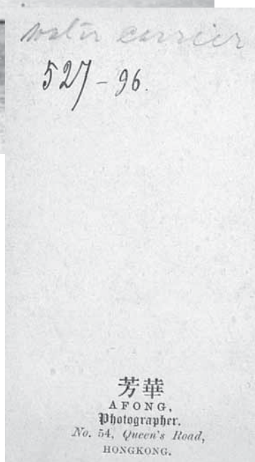
Рис. 1а. Обратная сторона с подписью и адресом мастерской Afong Photographer. МАЭ. Колл. № 527-96 об.