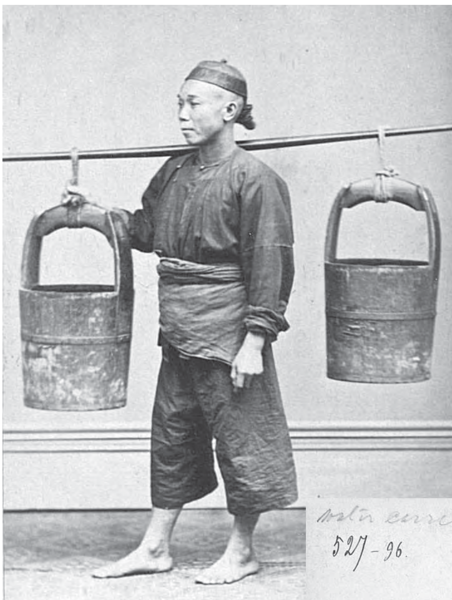
Рис. 1. Носильщик. Afong Photographer, 70-е годы XIX в. Альбуминовый фотоотпечаток, коллекция К. Н. Посьета. МАЭ. Колл. № 527-96