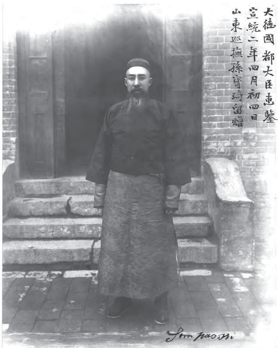
Рис. 4. Портрет наместника провинции Шаньдун Сунь Бао-ци. Дарственная надпись: «В дар консулу Великой Германии императорского наместника провинции Шаньдун Сунь Бао-ци, второй год правления Сюаньтун, начала месяца, четвертого дня». Неизвестный фотограф, начало XX в. Серебряно-желатиновый фотоотпечаток. Коллекция поступила из Центрального Военно-морского музея Ленинграда. МАЭ. Колл. № И-1599-27

Последней частью коллекции является серия отдельных серебряно-желатиновых фотоотпечатков, наклеенных на картонные паспарту различного формата (некоторые из них были опубликованы в упомянутом памятном альбоме). Особо ценны здесь подарки китайских чиновников консулам Германии, на паспарту сохранились их дарственные надписи на китайском или немецком языке.