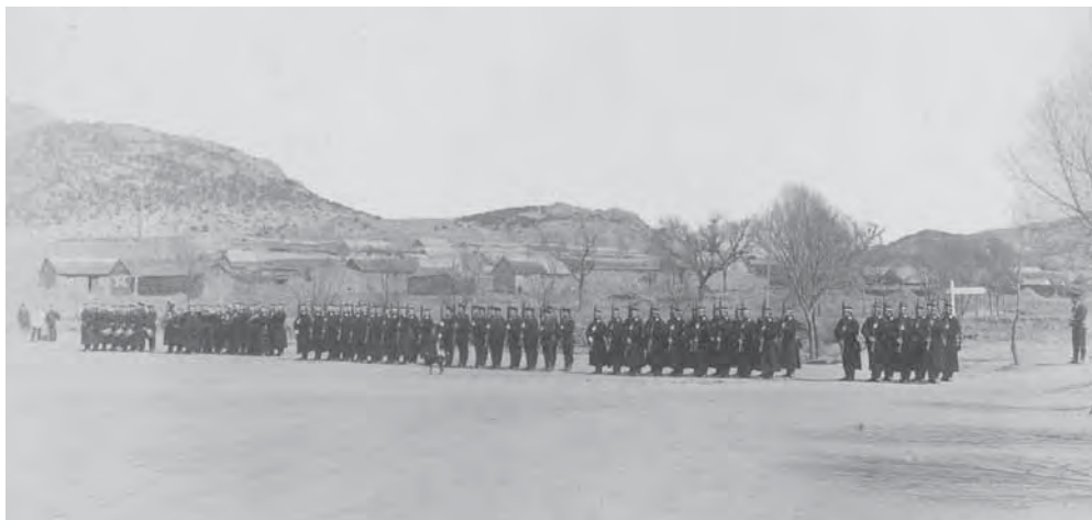
Рис. 2. Первый парад немецкого отряда. Неизвестный фотограф, 1898 г. Альбуминовый фотоотпечаток. Коллекция поступила из Центрального Военно-морского музея Ленинграда. МАЭ. Колл. № И-1599-16/35-32

Нельзя не упомянуть обширную коллекцию фотоматериалов, переданную в МАЭ после Второй мировой войны из Центрального Военно-морского музея Ленинграда. Все эти фотодокументы посвящены виртуальному путешествию по германским колониям в Азии и, в частности, присутствию Германии в Цзяочжоу.