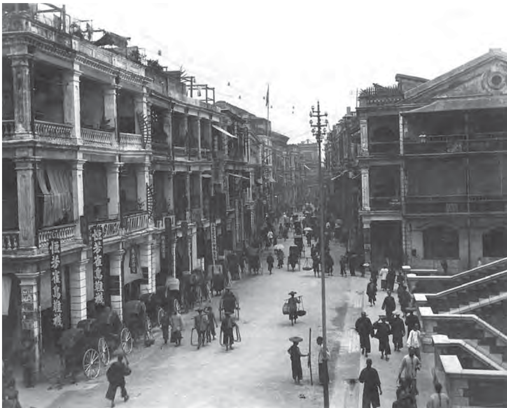
Рис. 3. Гонконг. Улица Queen's road. Неизвестный фотограф, конец XIX в. Альбуминовый фотоотпечаток. Коллекция поступила из Центрального Военно-морского музея Ленинграда. МАЭ. Колл. № И-1599-2/50-32

Под третьим и четвертым номерами в коллекции зарегистрированы две книги издания начала XX в. Они также посвящены жизни колонии в Цзяочжоу и путешествию по германским азиатским территориям от Генуи до Пекина. Вторая книга-альбом представляет наибольший интерес, так как является памятным изданием по случаю окончания срока службы Императорского чрезвычайного посла и полномочного министра Альфонса фон Мумма (1859—1924) и отъезда его из Китая в 1905 г. На первой странице есть посвящение: «Моим сотрудникам в Пекине на дружеское воспоминание об их шефе. Альфонс фон Мумм. Императорский чрезвычайный и посол и полномочный министр» [Опись № И-1599: 4 об. — 5].