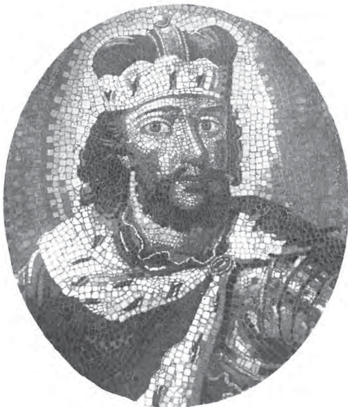
Рис. 1. Мозаика святой Александр Невский. МАЭ. Колл. № МЛ-01185