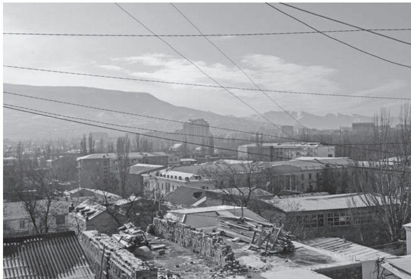
Вид на город