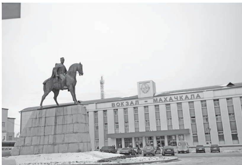
Памятник М. Дахадаеву у махачкалинского вокзала