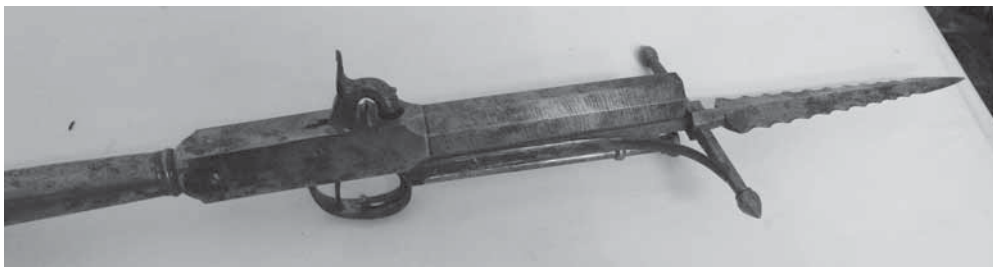
Рис. 1. Пика-пистолет. МАЭ. Колл. № 309-157

Кунсткамера — музей универсальный и уникальный одновременно. В европейских кунсткамерах собирались как различные диковинки, которые должны были позабавить посетителя, так и интересные образцы даров природы и творений человека, призванные посетителя просветить. Неудивительно, что в Санкт-Петербургскую Императорскую Кунсткамеру попали и удивительные творения индийских оружейников, призванные как позабавить, так и просветить и даже защитить посетителя. В каждом предмете — сочетание разных эпох и влияний. Возьмем, к примеру, комбинированное оружие пика-пистолет (колл. № 309-157; рис. 1), подарок бенаресского 2 раджи цесаревичу Николаю Александровичу, полученный наследником российского престола во время его путешествия по Индии в 1890–1891 гг. и переданную позднее (в 1896 г.) в Императорскую Кунсткамеру. Это образец индийского оружейного искусства, подчиненного вкусам европейского заказчика. Европейская тема, европейский контекст незримо присутствуют во многих индийских коллекциях в описании либо обстоятельств создания предмета, либо истории его приобретения.