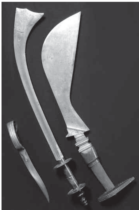
Рис. 4. Кинжал-бичхва (крайний слева). МАЭ. Колл. № 293-16