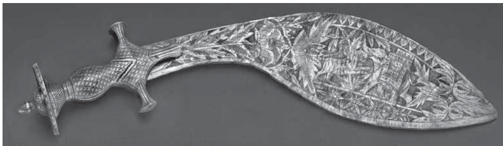
Рис. 3. Меч. МАЭ. Колл. № 309-144а

ским путешественникам, посетившим среди прочих городов священную Матхуру. Изображение Кришны и Радхи мы видим на мече листовидной формы. Его клинок напоминает лист священного дерева punal 4 . На клинке с одной стороны изображены Кришна и Радха, на другой — сошедшиеся в схватке лев и слон (колл. № 309-144а; рис. 3).