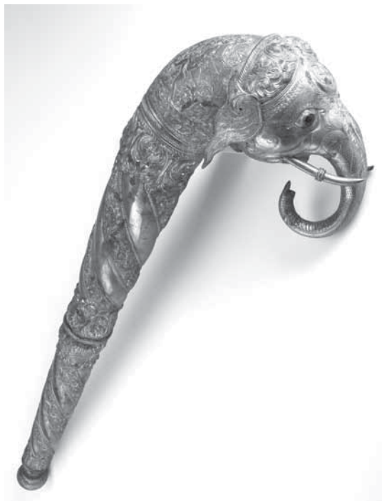
Рис. 5. Церемониальная палица. МАЭ. Колл. № 309-158