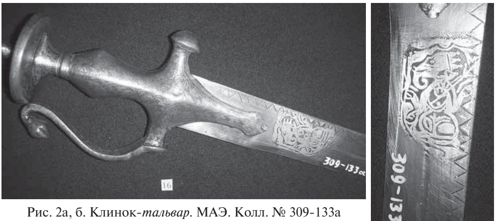
Рис. 2а, б. Клинок-тальвар. МАЭ. Колл. № 309-133а

Уже сам стиль описания предполагает, что полученные в дар или купленные наследником российского престола предметы — настоящие произведения искусства, образец качества и вкуса. Действительно, такие замечательные образцы в коллекции Кунсткамеры есть. Таков, например, клинок-тальвар, вероятно, изготовленный в г. Лакхнау, и там же, возможно, приобретенный (колл. № 309-133а; рис. 2а, б). Этот тальвар представляет собой стальную изогнутую саблю с красивым эфесом лакхнаууского типа, созданным, возможно, под европейским (вероятно, французским) влиянием (подобное описание см.: [Котин, Успенская 1997: 195]). В то же время эфес сабли украшен чисто индийским элементом — шишечкой («почкой») могра , а на клинке — изображение индусского божества Ганеши, приносящего, согласно индийскому поверью, удачу.