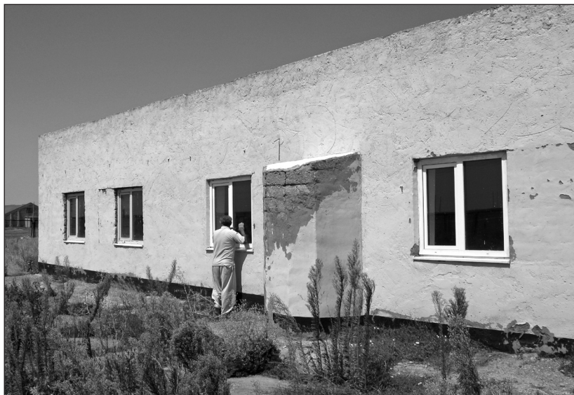
Рис. 2. Мечеть в селе Приозерное. 2010 г.