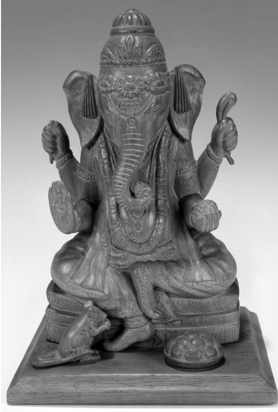
Рис. 3. Сандаловое изображение бога Ганеши. МАЭ РАН. Колл. № 6377-34