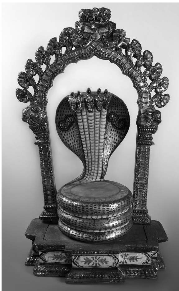
Рис. 2. Трон бога Вишну в виде свернувшегося змея Шеши. МАЭ РАН. Колл. № 3086-3

Рисовых хлопьев и сладкого молока, подружки, Снесем к его дому! (пер. Н.Г. Краснодембской. См.: [Краснодембская 2005: 93]).