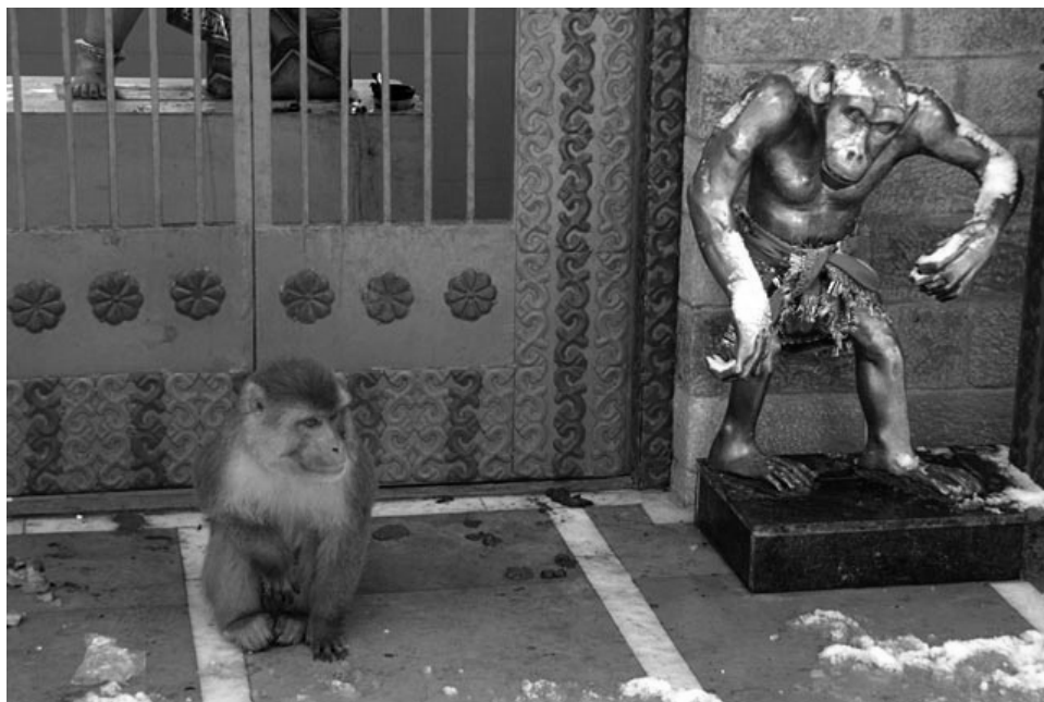
Рис. 1. Храм Ханумана.

ские и обезьяньи черты. Собственно, любое зооморфное существо не лишено в представлении индийцев человеческих черт, есть они, судя по многим изображениям, и у змей — ангов.