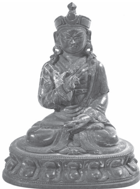
Рис. 13. Падмасамхава. Колл. МАЭ. № 782-3

вещей, не представлявших собственно этнографической ценности, но интересовавших Е.И. Александра, на два докшита (колл. № 1118).