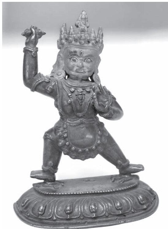
Рис. 6. Бодхисаттва Ваджрапани. МАЭ. Колл. №1426-2