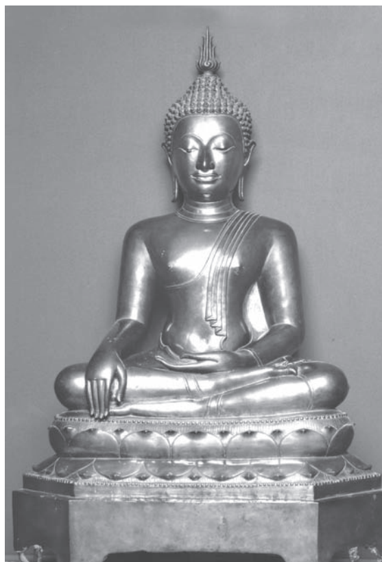
Рис. 19. Будда. Колл. МАЭ. № 2686-1

№ 2686 — прекрасная статуя бронзового Будды (находится на экспозиции, предположительно создана в XIV или XV в. в Северном Сиаме). Куплена у Сурина (рис. 19).