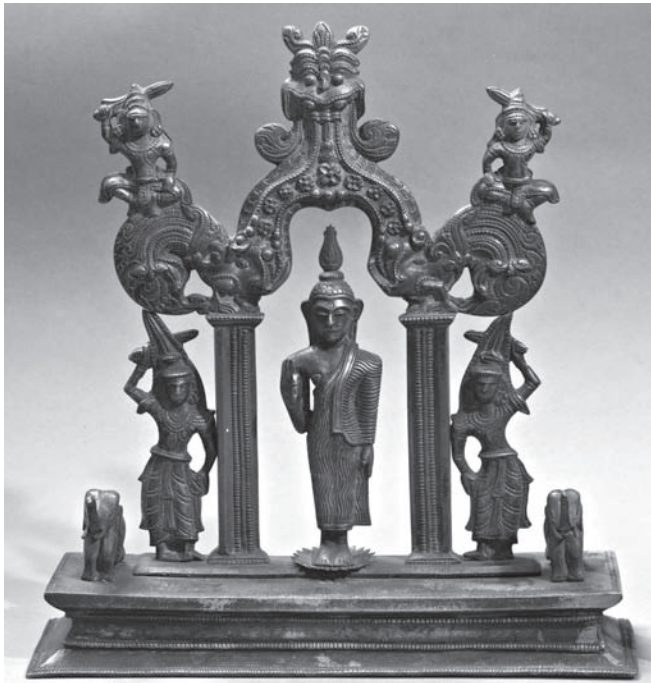
Рис. 17. Будда в окружении стражей сторон света. МАЭ. Колл. № 3179-1

Приведем слова Н.Г. Краснодембской: «Несколько коллекций содержат предметы сингальского буддизма — одежду буддийского монаха, изображения Будды, дарохранительницу, картины ланкийских мастеров, иллюстрирующие жизнь Будды и истории его перерождений, деревянную резную панель с изображениями на буддийские темы, украшавшие храмы» [Краснодембская 1983: 78–79].