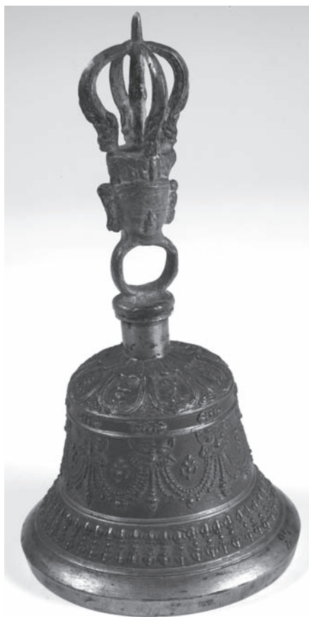
Рис. 16. Колокольчик. Колл. МАЭ. №226-1