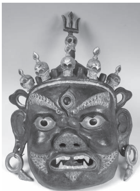
Рис. 11. Маска мистерии цам. МАЭ. Колл. № 542-1

О масках из этих коллекций см.: [Решетов 1987: 121–136].