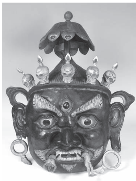
Рис. 12. Маска мистерии цам. МАЭ. Колл. № 591-1