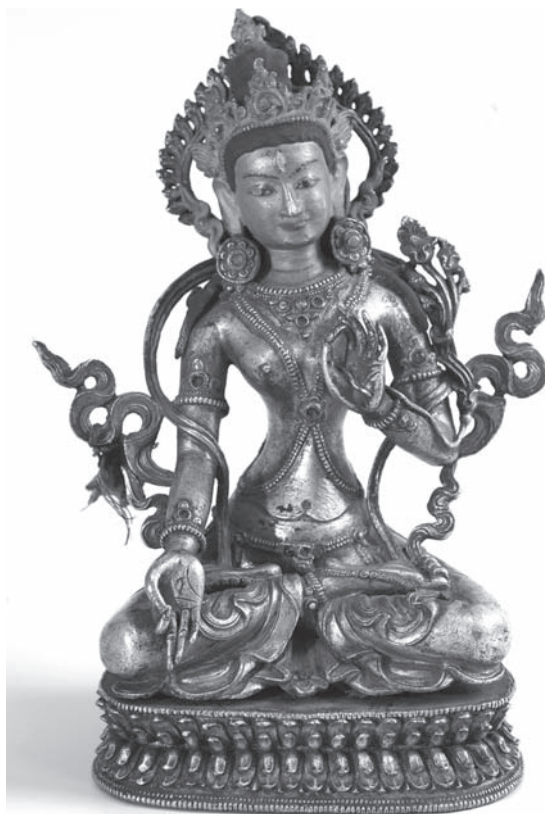
Рис. 14. Белая Тара. Колл. МАЭ. № 3005-1

А.Ф. Бекман продает за 40 р. коллекцию бронзовых бурханов (Белая и Зеленая Тара, Амитаюс, бодхисаттвы, лама) (№ 3918) (один бурхан — на экспозиции).