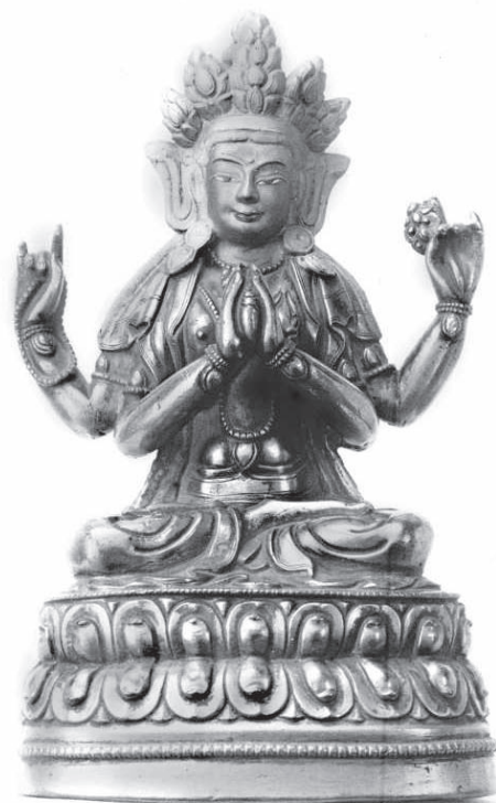
Рис. 7. Бодхисаттва Авлакишешвара. МАЭ. Колл. № 1489-1