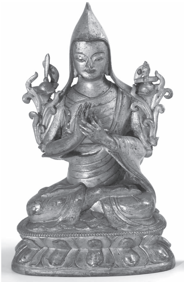
Рис. 1. ЦОНКАПА. МАЭ. Колл. № 710-58/3-2

тайском Туркестане. (Такая точность в указании местонахождения предметов, переданных в музей, является редким исключением на фоне преобладания неопределенности: гораздо чаще, к сожалению, не только отсутствует уточнение места в стране, из которой происходит предмет, но даже не всегда ясно из документации, из какой именно страны он привезен — из Китая или Японии, или из Китая или Монголии, или из Монголии или Бурятии и т.д.)