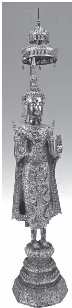
Рис. 18. Будда. МАЭ. Колл. № 1041-1