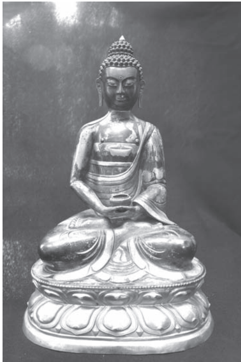
Рис. 15. Будда. Колл. МАЭ. № 6752-45

В этом же году поступила статуэтка Будды из коллекции П.К. Козлова, получившая номер 6752-45 (хранится в спецхране) (рис. 15).