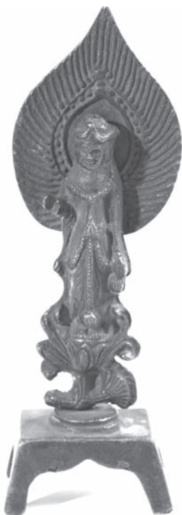
Рис. 2. Бодхисаттва Гуаньинь. МАЭ. Колл. № 890-1. Вид спереди