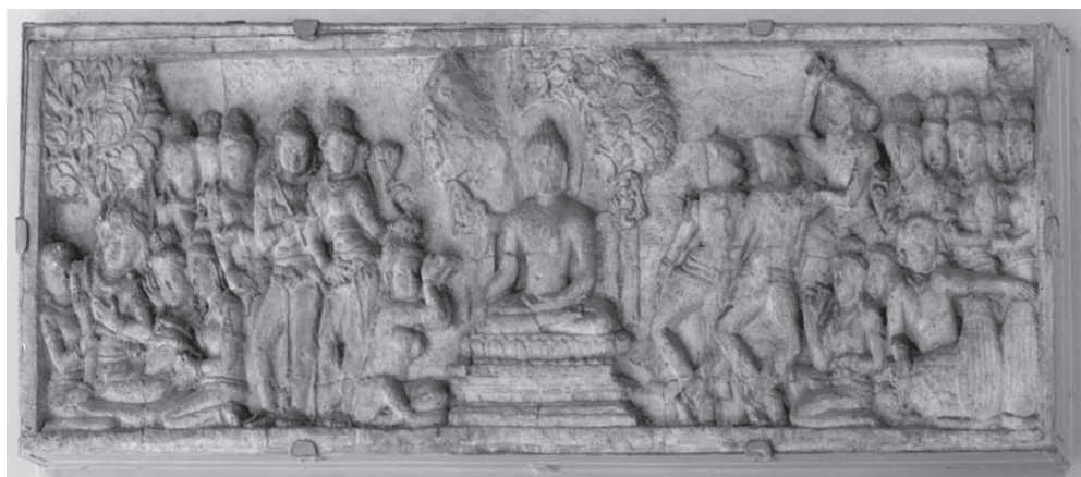
Рис. 21. Слепок с барельефа на храме Боробудур. МАЭ. Колл. № 158-16