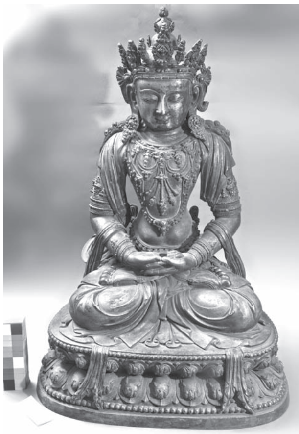
Рис. 5. Амитаюс. МАЭ. Колл. № 2951-8

ным, по его признанию, из китайского храма в окрестностях Пекина во время боксерского восстания (колл. № 3202).