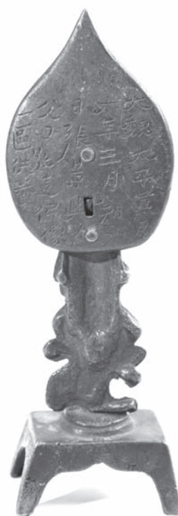
Рис. 2.1. Бодхисаттва Гуаньинь. МАЭ. Колл. № 890-1. Вид сзади