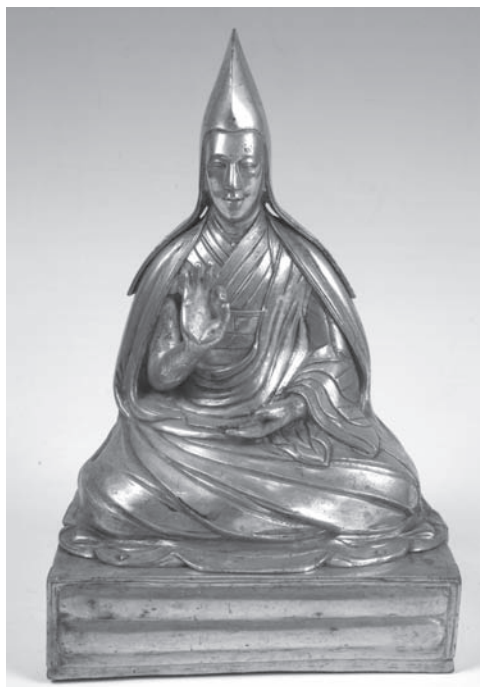
Рис. 10. Лама. МАЭ. Колл. № 719-2

Первым по времени поступления в Этнографический музей собранием предметов буддийского культа монголов и калмыков была коллекция, в 1902 г. зарегистрированная Адлером под № 719 с добавлением еще одного собрания буддийских статуэток, но все предметы этой коллекции до последнего времени считались собранными неизвестными лицами. Внимательное изучение старых списков Азиатского музея, всего состава коллекции, сверка бирок на статуэтках с описаниями в книге П.С. Палласа названий тех бронзовых статуэток, которые приобрел этот ученый, позволило Д. Иванову [2007] сделать вывод о том, что в этой коллекции находятся палласовские приобретения, отданные в музей, но не зарегистрированные сразу по поступлении, в результате чего с течением времени была утрачена информация о месте сбора этих вещей и об имени их собирателя. Обнаружение на некоторых фигурках бирок с именем Миллера (на № 719-85 и № 719-86) помогло молодому исследователю напасть на след предметов из другого «пропавшего» собрания (при проведенной при В.В. Радлове регистрации коллекция Миллера не упоминается, а П.С. Палласу «оставлена» из «буддийских» только коллекция № 741 [Руссов 1900] (рис. 10).