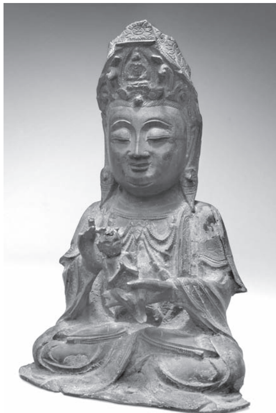
Рис. 3. Богиня Цзысуньян. МАЭ. Колл. № 1785-1