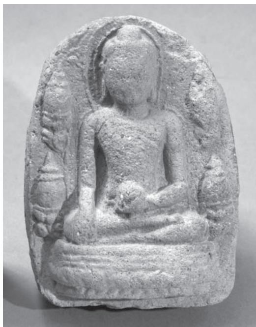
Рис. 20. Будда. Вотивная табличка. МАЭ. Колл. № 6815-29