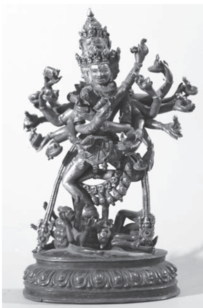
Рис. 9. Капалахеваджра. МАЭ. Колл. № 5942-226