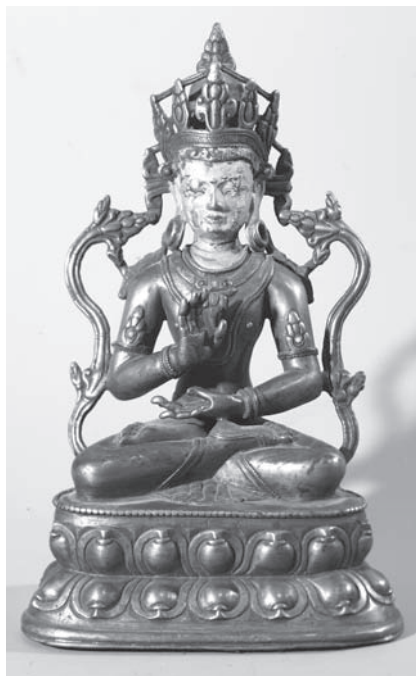
Рис. 8. Будда Амогхасиддхи. МАЭ. Колл. №5942-203

Другая коллекция, также переданная из ГМВК в МАЭ в том же 1950 г., № 5959, содержит четки, амулеты, иконы, хадаки, молитвы.