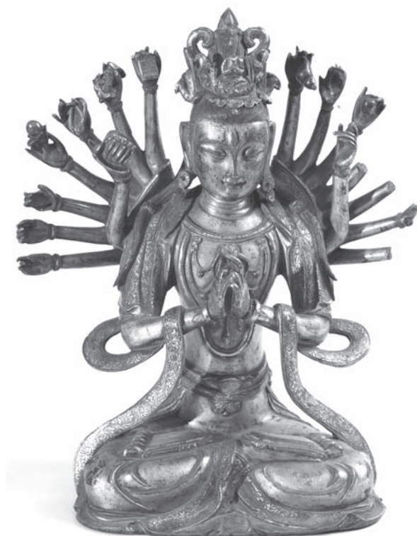
Рис. 4. Бодхисаттва Авалокитешвара. МАЭ. Колл. № 2694-2

Н.Н. Кротков приобрел для МАЭ в Восточном Туркестане буддийскую коллекцию из 14 предметов (металлические статуэтки Будды, Авалокитешвары, Амитаюса, Зеленой и Белой Тары, Майтреи, дакини, великих лам и др.) (№ 2694) (рис. 4).