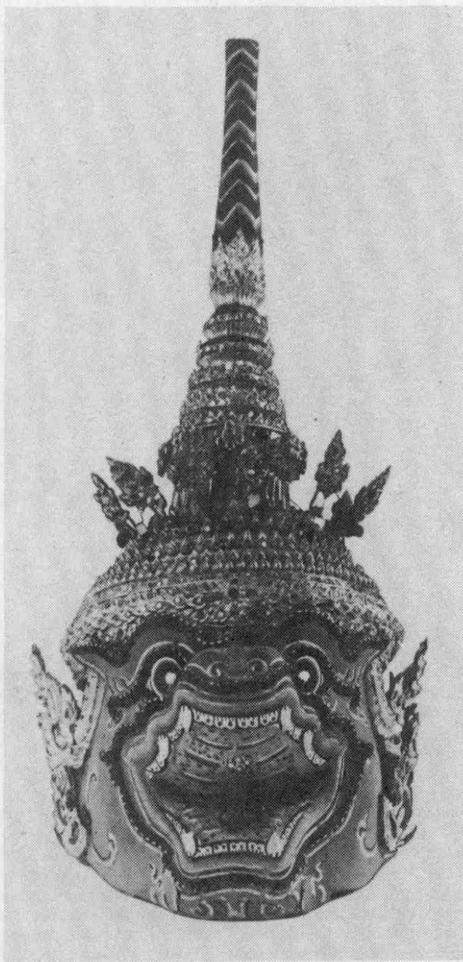
Рис. 5. Маска обезьяньего короля Сугривы (№ 6332-5).

Широкий вздернутый нос имеет посередине рельефную полосу, ноздри маленькие. Пасть сжата, но зубы оскалены, с каждой стороны среди ряда обозначенных белой краской зубов выделяется по два рельефных зуба. Губы раскрашены красной и розовой красками, обрамлены золотой и черной линиями. На некотором расстоянии от них — синяя полоса (оформленная так же, как полоса на бровях и вокруг глаз), очерчивающая рот, разорванная справа и слева под торчащими зубами. Дополняют роспись маски разбросанные там и сям трехцветные полосы и завитки у бровей, глаз, рта, на подбородке, в месте окончания пламевидного украшения, закрывающего ухо.