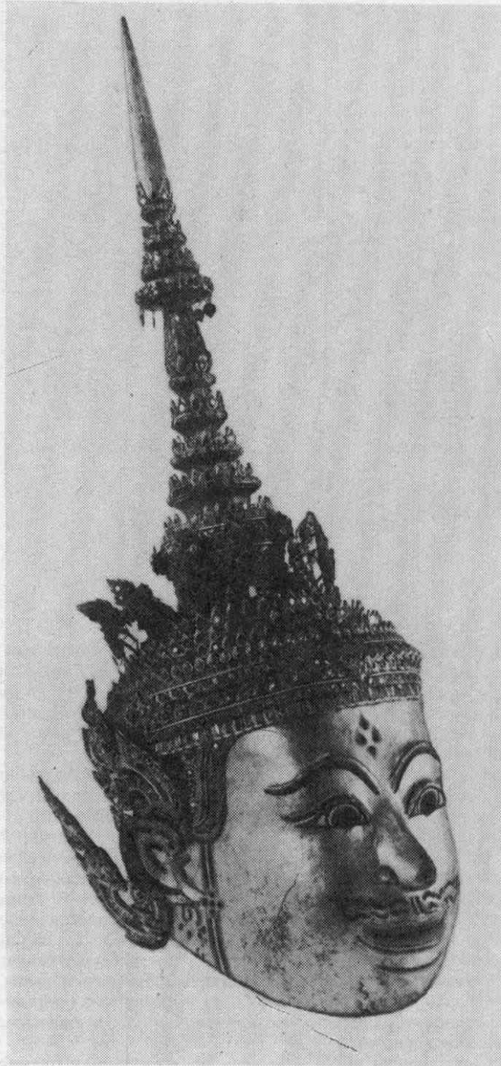
Рис. 8. Маска Лакшмана (№ 6332-8).

единяясь внизу прямой черной линией, как бы образуют нижнее веко. Вокруг черных зрачков (с круглым отверстием в центре для глаз актера) проведены голубая, белая и черная линии.