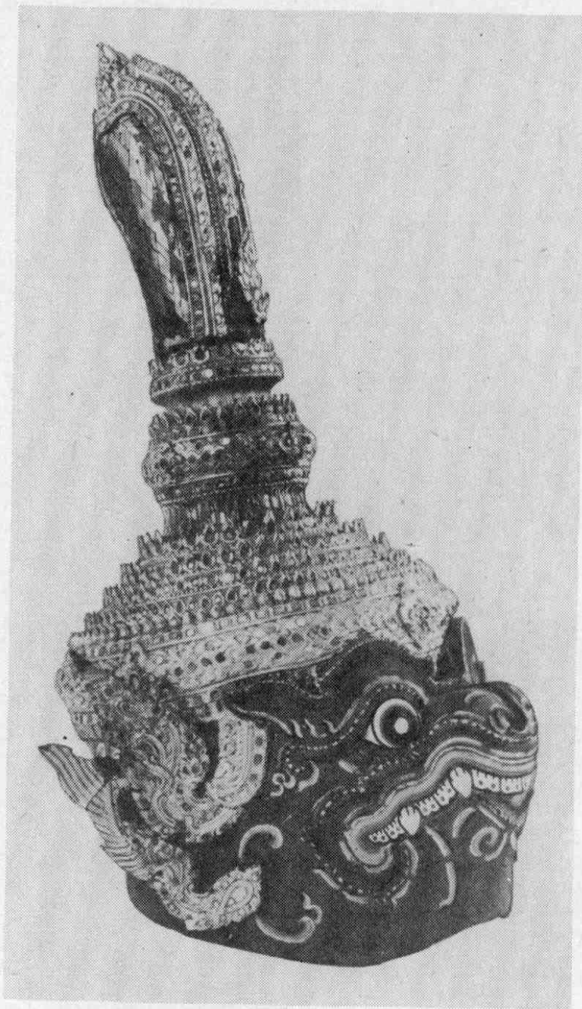
Рис. 6. Маска обезьяньего короля Онгота (№ 6332-6).

пламевидные «ячейки». Разделяет две половины «гребешка» рельефное ребро, с двух сторон оно декорировано зеркальцами и расположено в той же плоскости, что и обрамление флангов, повторяющее его формы и отделенное от него двумя бороздками, выложенными имитацией «зерни». Центральное ребро выше внешнего обрамления флангов, но, как и они, в высшей точке оно завершается треугольным, устремленным вверх языком пламени. У основания гребня, покоящегося на круглом основании, к центральному ребру «прислонен» еще один декоративный элемент пламевидных очертаний с зеркальцами в пламевидных «ячейках» (вырезанный из кожи, он покрыт вязущим веществом, орнаментирован, инкрустирован зеркальцами, как и остальная часть короны).