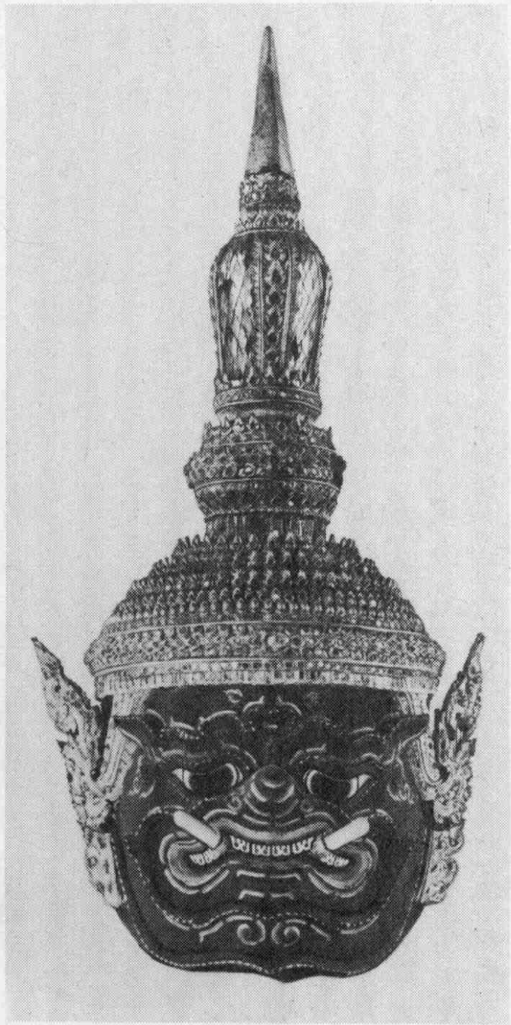
Рис. 3. Маска демона Пипека (№ 6332-3).

Оттопыренные уши в золотом пламевидном обрамлении скрыты накладными пламевидными украшениями (вырезанными из кожи, покрытыми связующим веществом, на котором сделан орнамент, инкрустированный зеркальцами), расположенными справа и слева. Они соединяются с укрепленной на маске короткой декоративной полосой, отходящей от короны. Корона по оформлению напоминает корону на маске Интрачита (№ 6332-2), отличия сводятся к следующему: на верхней части (до перехода в конусовидное многоярусное навершие) имеются приделанные к пружинке (закрепленной на проволочке), торчащие вверх пламевидные украшения (их всего 12 штук). К каждому из них прикреплены двусторонние зеркальца, от малейшего дуновения или толчка приходящие в движение. Самая верхняя часть (в отличие от № 6332-2) с определенного уровня имеет деревянную основу, но орнамент на ней сделан так же, как на папье-маше. Обрамление основания торчащего навершия (раскрашенного в коричневый цвет, с 10 зигзагообразными узорами, опоясывающими навершие по горизонтали сверху