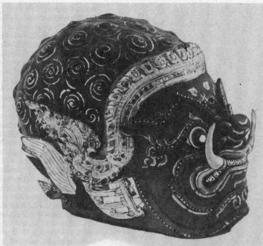
Рис. 1. Маска демона Кумпакарна (№ 6332-1).

помощью проволочек, украшения за ушами и корону. Рельефные части лица демона обведены по контурам извилистыми, сделанными красками лентами, которые подчеркивают смыкающиеся брови, линию, очерчивающую контуры выпученных глаз, соединяющиеся на переносице закруглениями, линию, очерчивающую рот (с «разрывами» на носу и под выступающими зубами), и линию внизу маски, поднимающуюся до середины скулы справа и слева. Все эти четыре полосы сделаны синей краской, имеют поперечные черные полосы внутри, обрамлены с одной стороны золотой линией с черным пунктиром, с другой — черной линией. Линии над бровями, глазами, ртом окаймлены розово-красно-золотыми полосами с завитками на конце. Из таких же линий орнамент на подбородке. На низком лбу — по обе стороны от центра — два пламевидных знака. Нос маленький, заостренный. Во рту (с извилистой верхней губой, нижняя отсутствует) виден ряд нарисованных зубов (белые с черными точками и полосками), два выпуклых зуба высовываются изо рта острием вниз.