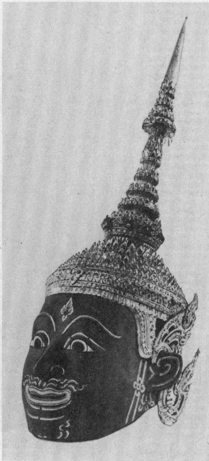
Рис. 4. Маска Рамы (№ 6332-4).

донизу) также своеобразно: 8 пламевидных со стеклышками украшений, с вершинами, устремленными вверх.